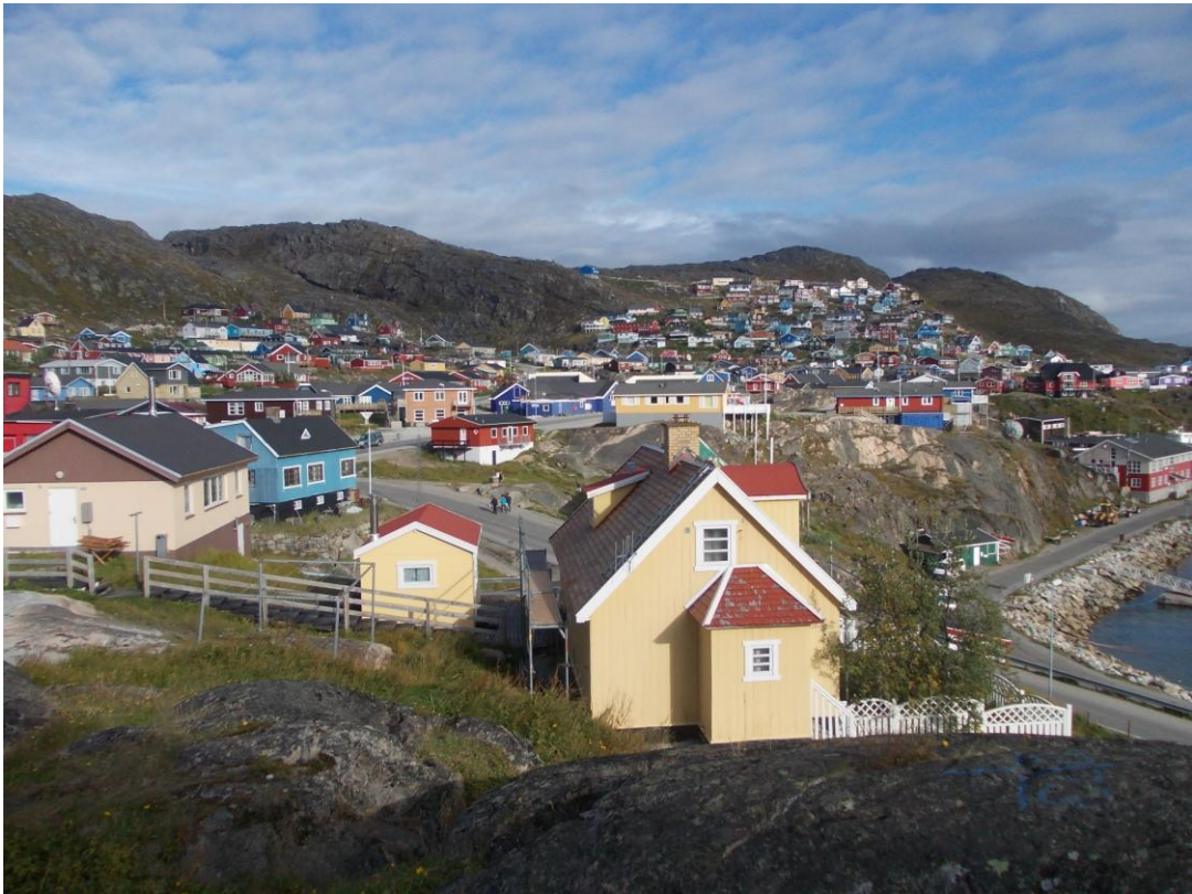
KUVIO 2. Qaqortoqin värikkäitä taloja (Myllymäki 2012)