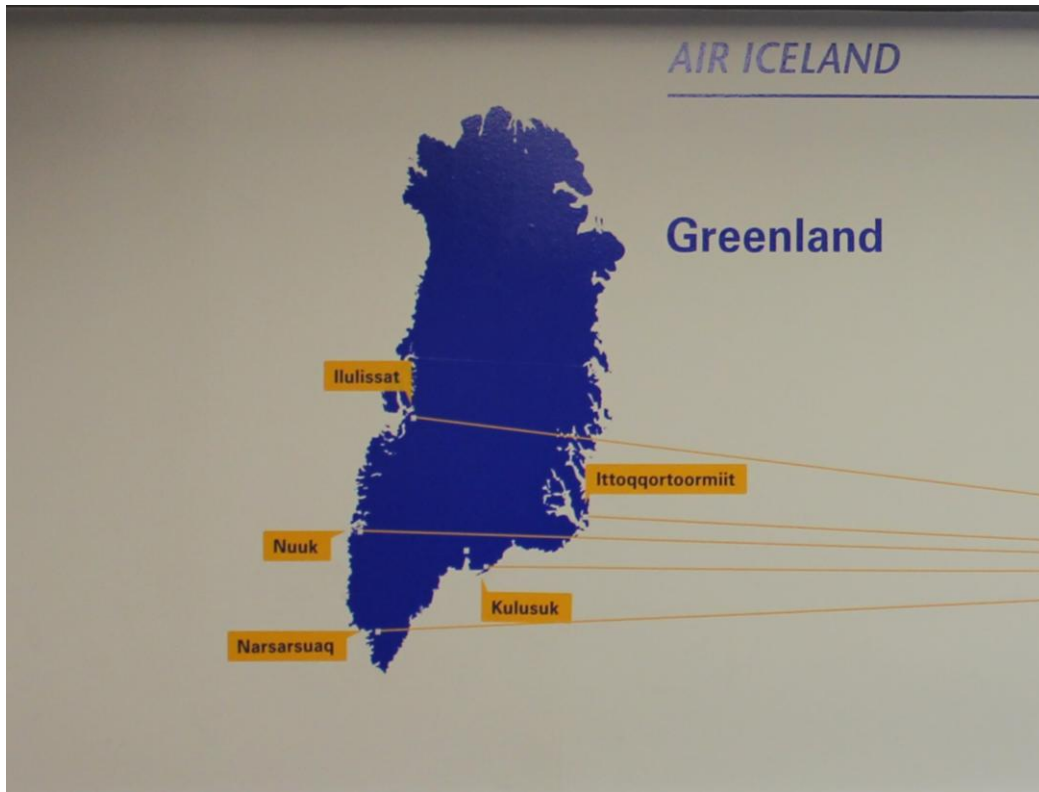
KUVIO 1. Grönlannin kartta (Myllymäki 2012)

Grönlannin kaikki kaupungit ja kylät ovat meren rannalla. Poikkeuksen tähän tekee ainoastaan Kangerlussuaq, missä on myös ainoa kansainvälinen lentokenttä. (Uppikk 2011.34, 52.)