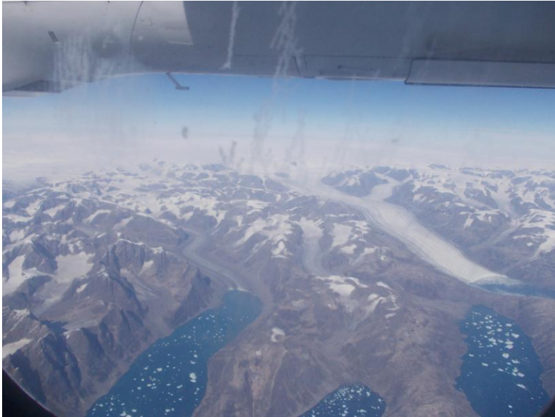
KUVIO 3. Grönlannin yllä jäävirta (Myllymäki 2012)

Kun menimme tulopäivänä veneellä kohti Qaqortoqia, meressä oli paljon jäälauttoja ja pieniä jäävuoria. Onneksi kuljettaja oli taitava väistelemään niitä. Opas kertoi, että kun jää sulaa koko ajan, niin jäälautat ajautuvat vuonojen suulta avomereille. Edellisenä päivänä oli ollut todella kova myrsky ja myräkki ja lautat olivat lähteneet liikkeelle. Kolme päivää myöhemmin, kun palasimme samaa reittiä takaisin, jäljellä oli enää vain isompia lohkaraita kellumassa. Muut olivat aurinko ja + 15 asteen lämpötila sulattaneet.