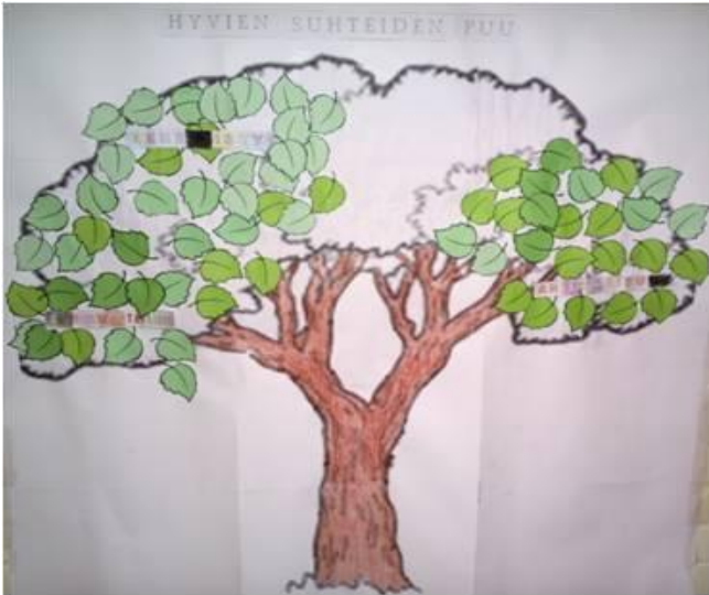
KUVA 4. Hyvien suhteiden puu. Rehellisyys

Kolmannessa tapaamisessa, jonka aiheena oli rehellisyys (Kuva 4), huomasimme, että lapset tottuivat jo tuokioiden rakenteeseen, ja ennakoivat sen kulkua. He kertoivat innostuneina, miten hoitivat puuta viikon aikana ja liimasivat lisää lehtiä puuhun huomaten, että se vihertyy yhä enemmän.