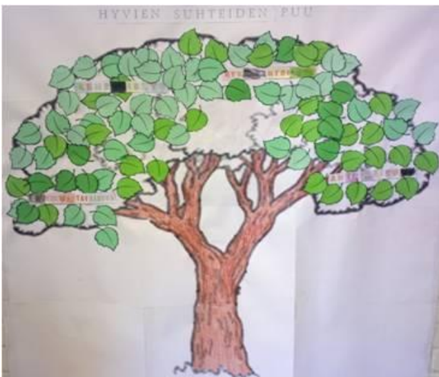
KUVA 5. Hyvien suhteiden puu. Hyvántahtoisuus

Neljännän tuokion aiheena oli hyvántahtoisuus (Kuva 5). Tuokio meni sujuvasti ja lapset osallistuivat mielellään toimintaan ja muun muassa kertoivat, mitä tekivät viikon aikana hoi- taakseen puuta ja liimasivat lisää lehtiä puuhun sekä pohtivat, mitä hyvántahtoisuus tarkoittaa.