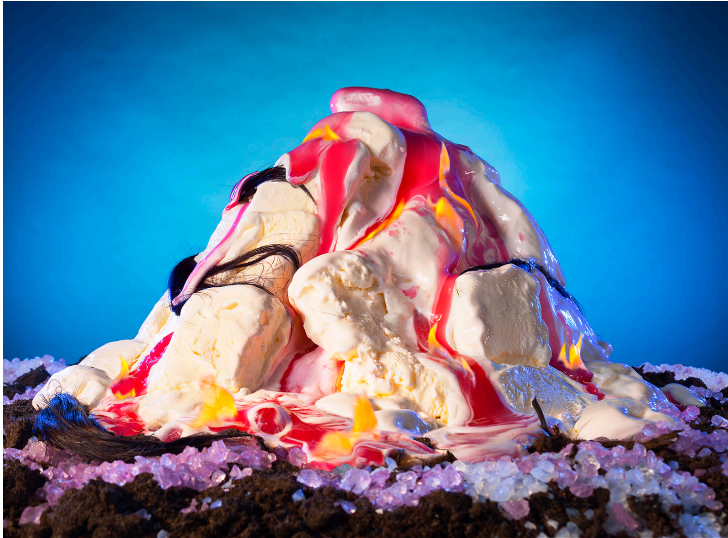
Mountain, 104 x 141,5 cm