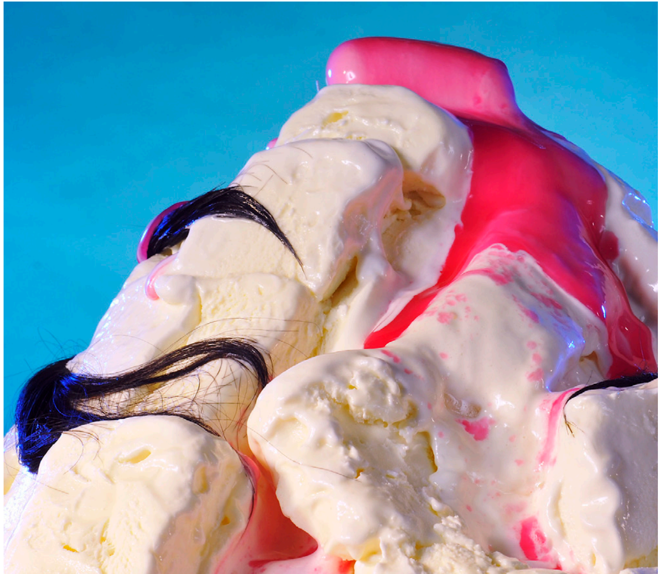
Yksityiskohta Mountain-kuvan prosessikuvasta

Vastenmielisten elementtien tehokasta vaikutusta katsojiin voi selittää Julia Kristevan abjekti-teorialla. Kristeva kuvaa abjektilla ambivalenttia subjektin muo-