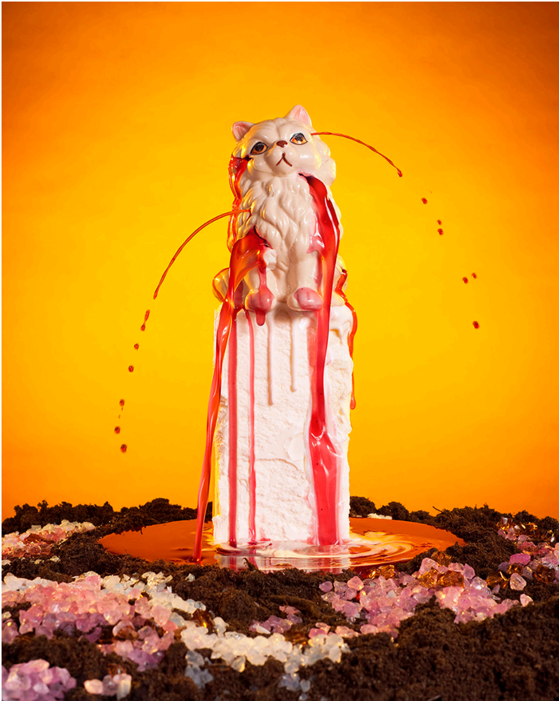
Monolith, 113 x 91 cm