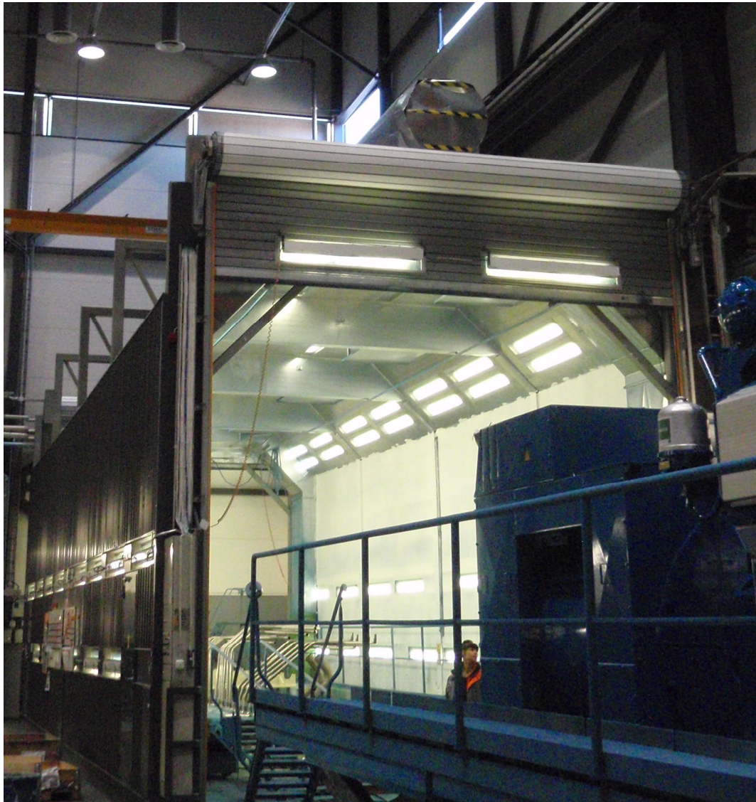
Kuvio 1. Maalaukammio

Ennen maalauksen aloittamista maalari sulkee kammion ovet ja asettaa ilmanvaihdon päälle. Maalaustekniikkana käytetään ruiskumaalausta, joten ilmanvaihdon maalaukammioissa on oltava voimakas. Ilmanpoistokoneet imevät ilmaa pois kammioiden lattiatasosta ja puhaltavat sen suodattimien kautta ulkoilmaan. Korvausilma kammioihin saadaan niiden katoissa sijaitsevista aukoista, suoraan viimeistelyhallien ilmatilasta. Ilman lämpötila ja kosteus maalaukammioissa ovat siis täysin vastaavat kuin viimeistelyhalleissa, joiden sisällä kammiot sijaitsevat. Kun maalaus on valmis, sammuttaa maalari