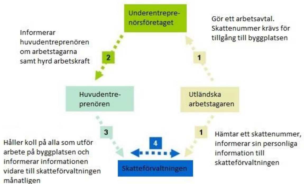
Figur 1. Förebyggandet av den gråa ekonomin. (Rakennusteollisuus, Gråa marknadens förebyggande)

Systemet för förebyggandet av den gråa ekonomin kan man se i figur 1. Systemet går ut på att den utländska arbetstagaren först hämtar ett skattenummer och meddelar sina personuppgifter till skatteverket, sedan gör arbetstagaren ett avtal med underentreprenören och meddelar även sitt skattenummer till underentreprenören. Ett skattenummer är obligatoriskt att ha för att få vara på byggplatsen. År 2012 blev även ett personkort med bild samt skattenummer obligatoriskt för varje person som rör sig på byggplatser. När underentreprenören fått uppgifterna av arbetstagaren måste underentreprenören meddela huvudentreprenören vilka arbetstagare som utför arbetet. Huvudentreprenören måste sedan övervaka alla arbetare på byggplatsen och meddela deras uppgifter till skatteverket månatligen. Skatteverket kontrollerar och jämför uppgifterna de fått och övervakar att allt går enligt lagen. (Rakennusteollisuus, Gråa marknadens förebyggande och Veronumero, Personkort med bild)