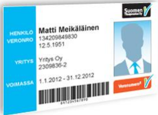
Figur 2. Personkort med bild. (Veronumero, Personkort med bild)

Förutom detta behövs det flera åtgärder än de som existerar redan. Arbets- och näringsministeriet har en arbetsgrupp som försöker förebygga den grå ekonomin i samarbete med Rakennusteollisuus och Rakennusliitto. I gruppens utredningar har man kommit till att det skulle behövas ändringar i lagarna samt ökad övervakning. Andra viktiga åtgärder skulle vara att huvudentreprenören skulle vara skyldig att meddela skatteverket om alla arbetstagares uppgifter samt beloppen på underentreprenörernas kontrakt. Dessutom borde övervakningen skärpas. I beställaransvarslagen borde finnas mer specifika punkter med hjälp av vilka man bättre kunde förebygga grå ekonomi. Sådana specifikationer vore t.ex. att höja försummelseavgiften till 50 000 euro istället för den nuvarande avgiften på 16 000 euro. Beställaransvarslagens utredningsskyldigheter borde krävas i all verksamhet. Rakennusteollisuus stöder fullt dessa åtgärder även om det skulle orsaka tilläggskostnader på flera tiotals miljoner euro för företagen. (Arbets- och näringsministeriet, Talousrikollisuuden ja harmaan talouden torjuminen rakennus sekä majoitus- ja ravitsemisalalla-työryhmä mietintö 2011.)