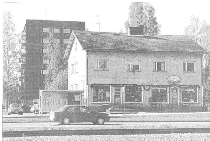
KMV -LEHTI 4.6.1996