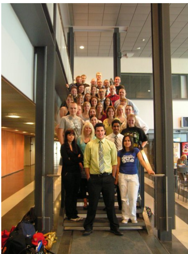
Kuva 4. Kesäkoululaiset yhteispotretissa.

Elokuvaa leikatessani koin edelleen haasteelliseksi löytää yhteistä nimittäjää teokselle. Elokuvan valmistumista odottivat ennen kaikkea amerikkalaiset kesäkouluopiskelijat. Teoksen tarkoitus on markkinoida tulevaa tai tulevia kesäkoulu-toteutuksia. Onko lopullinen kokonaisuus ja muoto objektiivinen, tulevia matkalle lähtijöitä palveleva vai enemmänkin subjektiivinen (vaikkakin positiivinen) kertaus vuoden 2008 kesäkoulusta ja ennen kaikkea kuvaus sen hahmoista? Vaikka lopullinen muoto poikkeaaakin ennakkoon tehdyistä suunnitelmista ja ajatuksista, on kokemisen teema ihmiskeskeisesti pitänyt pintansa koko kaaren ajan. Hahmojen, erilaisten luonnekuvausten ja kokemuksien inhimillistämisen kautta olen alusta asti halunnut luoda pohjan teokselle. Näiden lisäksi teos on realistinen kuvaus, vaikkakin mainosarvonsa takia esittäytyykin nimenomaan positiivisessa valossa. Kesäkoulu kokonaisuutena, sen itsekkin läpikäyneenä, oli aidosti positiivinen kokonaisuus ja yhdistelmä tehokasta opiskelua sekä energiarikasta vapaa-aikaa.