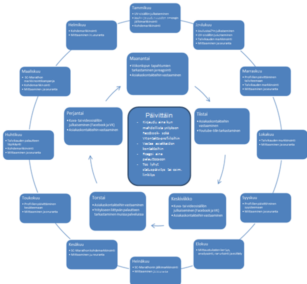
Kuvio 6. Kalenterikuvio (ks. liite 4)

Toimintasuunnitelmaan (ks. liite 3) on merkitty ehdotetut toimenpiteet seuraavalle noin kahdelle vuodelle, näiden toimenpiteiden vastuuhenkilöt, vaadittavat resurssit. Toimintasuunnitelmaa tulisi täydentää sitä mukaa kun tarkempaa tietoa olisi saatavilla. Toimintasuunnitelman ohien kehitimme kalenterikuvion, johon kirjasimme ehdottamamme päivittäiset, viikoittaiset ja kuukausittaiset toimenpiteet (ks. liite 4). Kalenterikuvion ajatuksena on selkiyttää ja rytmittää sosiaalisen median toimintaa.