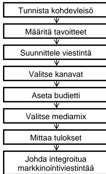
Kuvio 3. Markkinoinnin suunnitteluprosessi (Kotler–Keller 2006, 561)

Markkinointiviestinnän suunnittelukehän voi kuvata tarkemmin vielä markkinoinnin suunnitteluprosessia kuvaavalla kuviolla (Kotler–Keller 2006, 531). Suunnitteluprosessin myötä saadaan aikaiseksi useampiosainen ja -vaiheinen kokonaisuus, joka on toteutettavissa johdonmukaisesti. Sosiaalisen median toimintasuunnitelmassa tätä prosessia on pyritty noudattamaan (ks. liite 3).