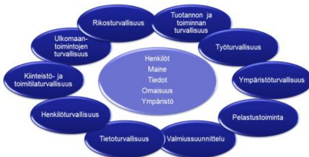
Kuvio 2: Yritysturvallisuuden osa-alueet (Elinkeinoelämän keskusliitto 2013).

Seuraavassa taulukossa on esitetty yritystoimintaa kohdanneet vahingot vuodelta 2011. Tilasto selventää, minkälaisien haasteiden parissa yritysturvallisuus alana toimii. Luvut ovat osa Sisäasiainministeriön Sisäisen turvallisuuden ohjelman seurannassa käyttämistä tunnusluvuista.