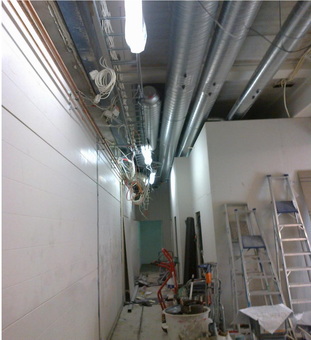
Kuva 3. Kuvan vasemmassa yläkulmassa näkyvät tilapäiset vesijohdot, jotka palvelevat työalueen rajaavan, tilapäisen Paroc-seinän takana olevaa kahvilaa. (ITIS Uudistuu -hanke).