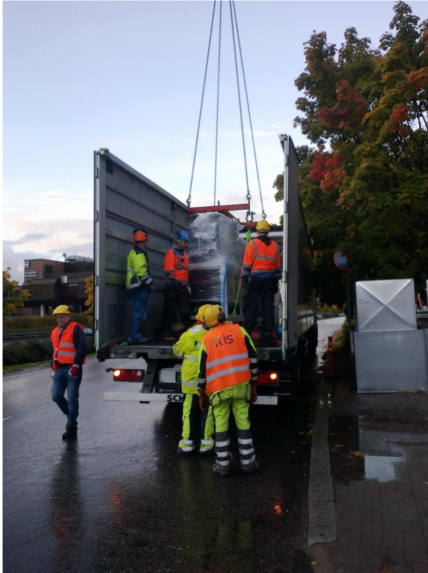
Kuva 2. Vedenjäähdytyskone nostettiin torninosturilla vesikatolla sijaitsevaan uuteen IV-konehuoneeseen (ITIS Uudistuu –hanke).