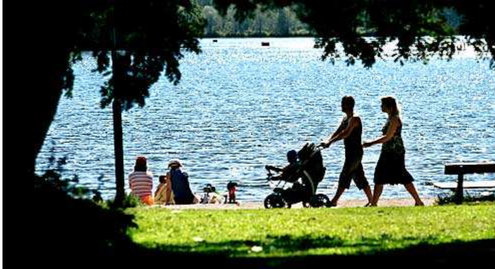
Joutjärven rannat ovat olleet alusta asti yksi Möysän valtteja.

23.8.2013 19:11 - päivitetty 24.8.2013 13:20 - Hanna Leppänen