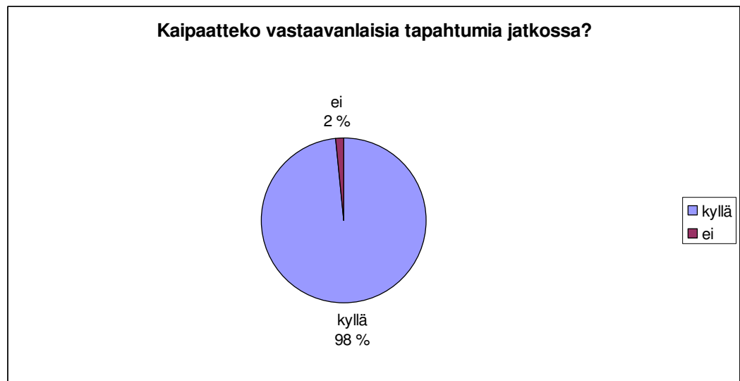
Kuvio 3: Tapahtuman tulevaisuus

Kaikki vastaajat yhtä lukuunottamatta toivoivat vastaavanlaisia tapahtumia myös jatkossakin (kuvio 3). Sukupuolella, iällä, asumismuodolla tai asumisajalla ei ollut vaikutuksia asukkaiden kokemuksiin juhlasta ja sen aikaansaamista hyödyistä, vaan kaikki vastaajat kokivat juhlan ja sen vaikutukset myönteisinä.