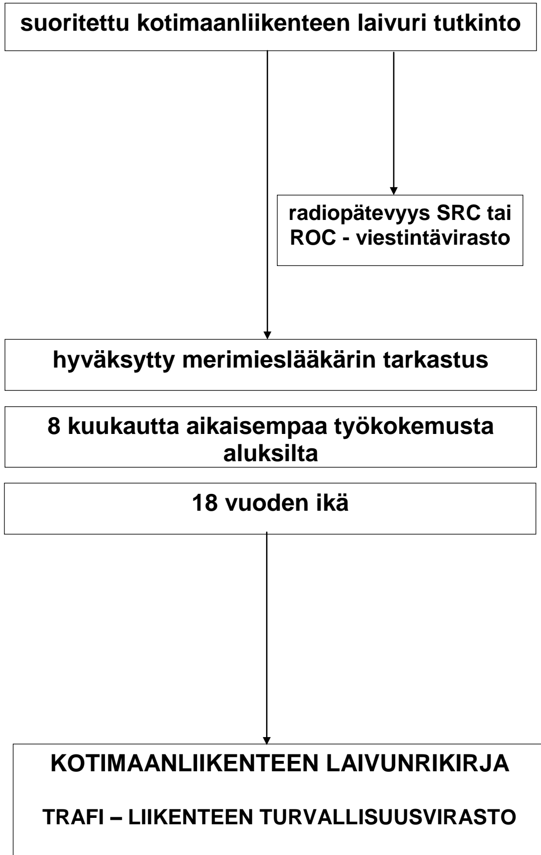
kuva 1. Kotimaanliikenteen laivurikirjan pätevyysvaatimukset