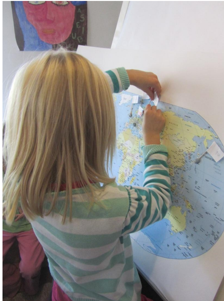
KUVA 5: Lippu karttaan.

Seuraavaksi otin esille fläppitaulun ja ison paperin. Kysyin lapsilta tietävätkö he sanoja muilla kielillä. Aluksi valitsin lapsia yksitellen taululle kirjoittamaan ja kysyin aina mitä kieltä se oli ja mitä se tarkoittaa, mutta lasten innostuessa tungeksimaan taulun eteen, annoin vain kaikille tussit käteen ja päästin heidät kirjoittamaan samaan aikaan. Taulu tuli täyteen erilaisia sanoja ja keskustelimme vähän aikaa niistä. Sitten siirryimme pöydän ääreen katsomaan hedelmiä. Ruoka-aika alkoi jo lähestyä joten lapset olivat levottomia ja annoimme heille aluksi banaanit. Kerroin banaanien tulleen Kolumbiasta ja katsoimme kartasta missä se on. Sitten aloin hedelmä kerrallaan pilkkoa ja kertoa hedelmistä. Kysyin aina onko joku maistanut sitä hedelmää ja kerroin mistä maasta se tulee. Pilkoin aina hedelmän ja annoin jokaiselle pienen maistiaisen. Aluksi lapset maltoivat odottaa että pilkon hedelmän, mutta sitten käsiä alkoi olla jo ojennettuina ennen kuin edes olin halkaissut hedelmän. Kaikki maistelivat kaikkea hyvin ennakoluulottomasti. Hedelmien maistelun aikana paikalle oli tullut uusiakin lapsia ja he pääsivät mukaan maisteluun kun muut ohjaajat selittivät heille mitä tapahtuu. Tarkoitukseni oli ollut tehdä vielä teatteria, mutta siihen ei jäänyt aikaa.