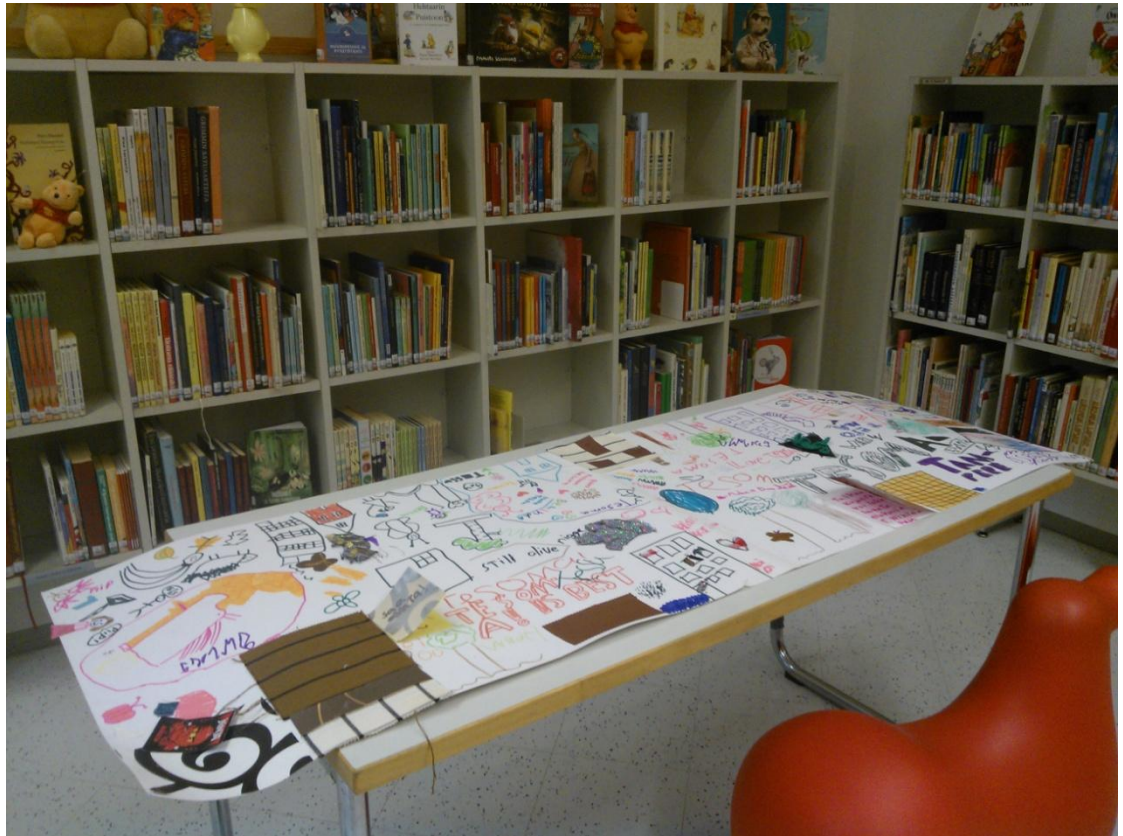
KUVA 7: Maailma Tesomassa- teos kirjastossa