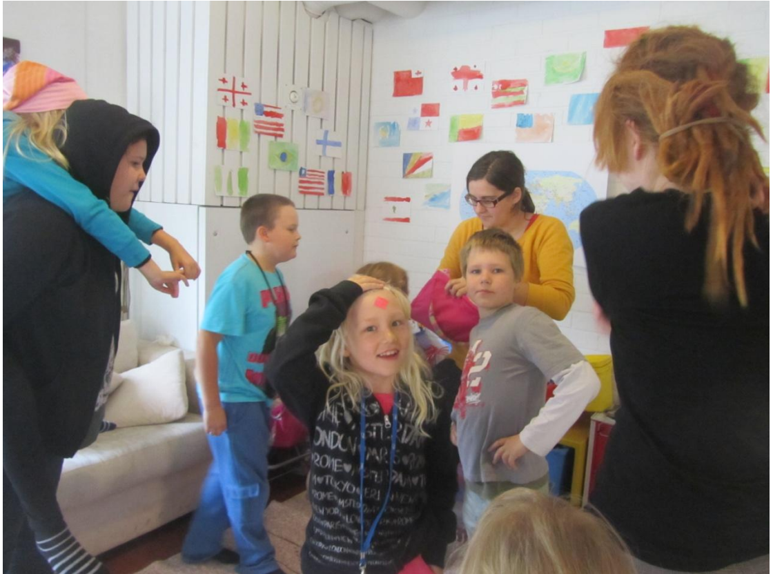
KUVA 4: Tarrat otsassa.