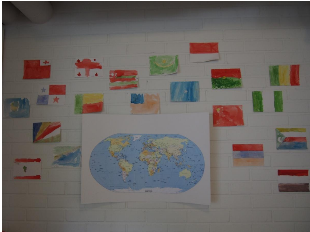
KUVA 2: Kartta ja lippuja Wihreän Puun seinällä.