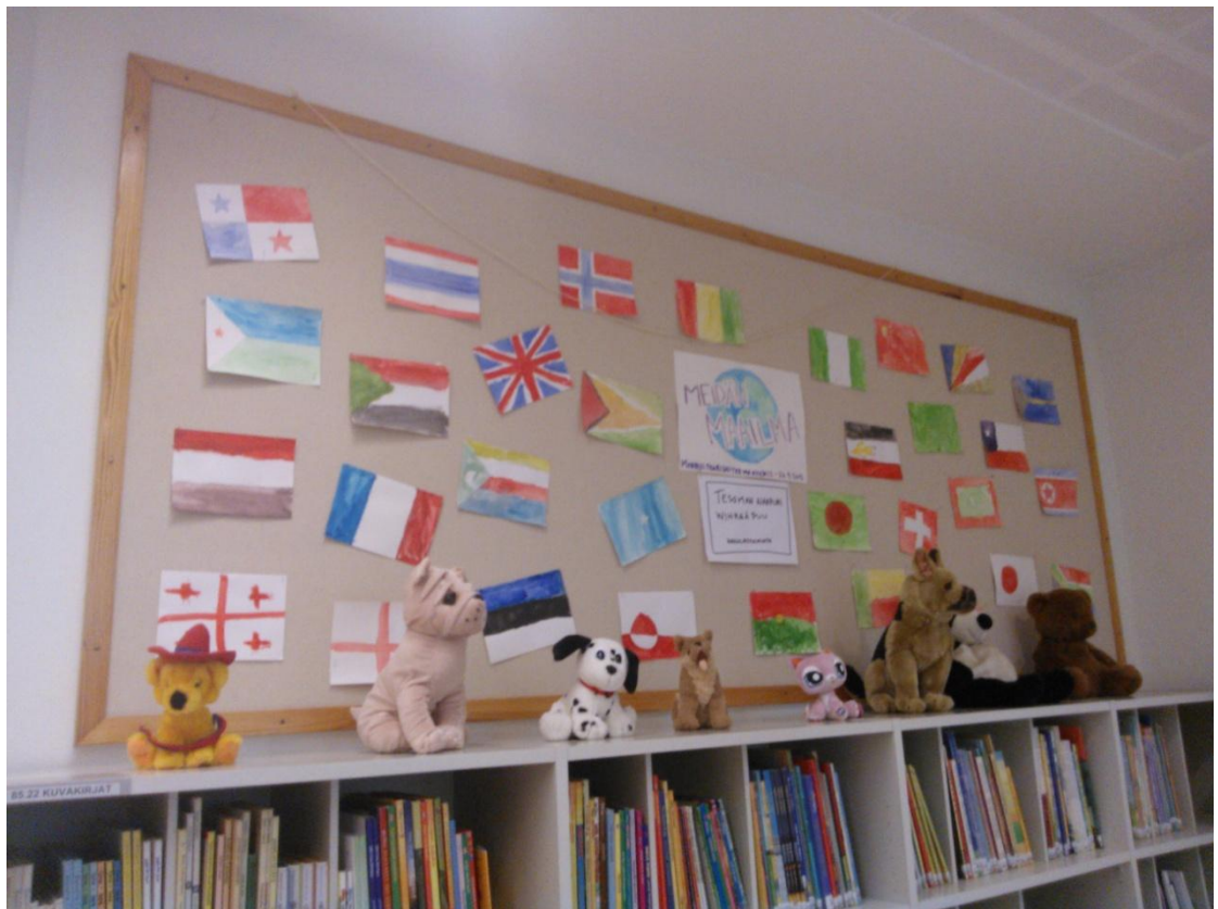
KUVA 6: Liput kirjastossa

Lasten Maailma Tesomassa -teos, liput ja tarinat kävimme viemässä Tesoman Kirjastoon näyttelyksi lasten osastolle. Kun kerroin lapsille heidän työnsä olevan näytillä, he halusivat innoissaan mennä katsomaan näyttelyä. Osa lapsista oli käynyt jo perheensä kanssa katsomassa näyttelyä, mutta osa halusi vielä käydä katsomassa sen. Kävin kolmen lapsen kanssa katsomassa kirjastossa näyttelyä. He katsoivat näyttelyä hetken ja luin heille muutaman sadutetuista saduista, mutta loppujen lopuksi voiton vei itse kirjasto. Lapset olivat innoissaan kaikista kirjoista ja paikasta, sillä kaksi heistä eivät käyneet kirjastossa perheensä kanssa, eikä heillä ollut kirjastokortteja.