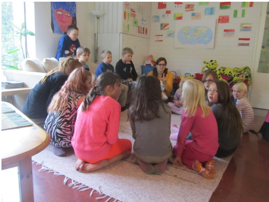
KUVA 3: Ensimmäinen piiri.

Seuraavaksi jokainen sai leikata ja piirtää itselleen oman vaakunan. Omaan vaakunaan jokainen sai piirtää asioita, joista tykkää tai joissa on hyvä. Kaikki eivät osallistuneet, mutta se ei haitannut osallistujia, koska he tekivät läksyjä tai jotain muuta sitten sillä välillä. Alkukankeuden jälkeen vaakunoita tehtiin innoissaan, osalla ei yksi paperi meinannut riittää. Kun kaikkien vaakunat olivat valmiita, pyysin lapsia menemään jonkun ohjaajan luokse ja sitten pienemmissä ryhmissä kävimme läpi vaakunat. Oman vaakunan lapset jaksoivat hyvin selittää ja pienemmissä ryhmissä muidenkin kuunteleminen onnistui.