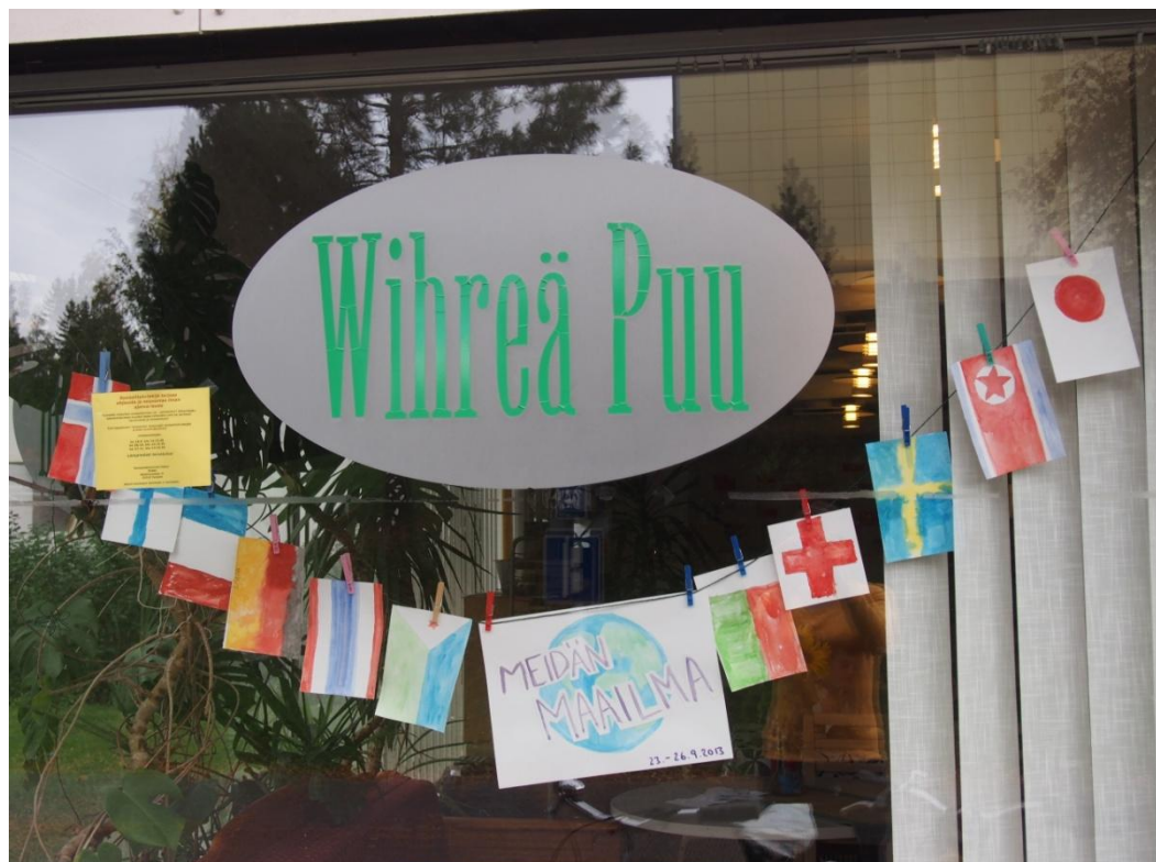
KUVA 1: Wihreän Puun ikkuna viikon aikana.

Aloitin viikkoon valmistautumisen edellisellä viikolla ripustamalla seinälle ison maailmankartan sekä maalaamalla lasten kanssa eri maiden lippuja. Lapset innostuivat kovasti lippujen maalaamisesta ja ripustin kaikki liput seinille. Siinä ne herättivät muidenkin mielenkiintoa kun mietittiin yhdessä välillä että minkä maan lippu mikäkin on. Sovimme muiden ohjaajien kanssa, että jokaisen toimintapäivän päätteeksi lapset saavat palkinnon osallistumisesta. Tesoman Naapurissa on töissä kolme ohjaajaa, tässä osassa kutsun heitä ohjaaja A, B ja C. Halusin ohjaajien osallistuvan mahdollisimman paljon toimintaan, ei ohjaajana vaan ryhmän jäsenenä. Näin halusin synnyttää ohjaajien ja lastenkin välille erilaista kohtaamista ja tutustumista kuin normaalisti. Järjestin toiminnan Wihreässä Puussa, vaikka minulle tarjottiin myös vaihtoehtoksi erilliseen tilaan menemistä lasten kanssa. Halusin, että toiminta tavoittaa myös ne, jotka eivät heti innostu toiminnasta.