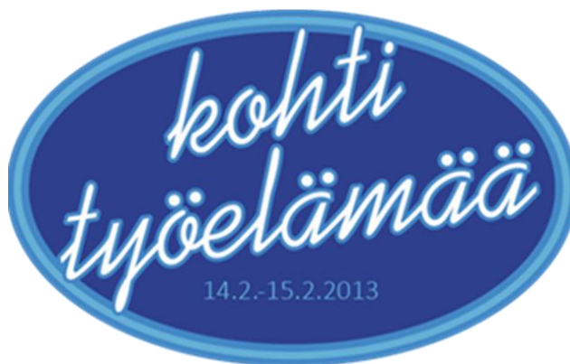
KUVA 1. Kurssin logo

Kurssin logo, joka liitettiin työnhakukurssiin, jäljitteli kykyjen etsintäkilpailun logoa. Kantavana ajatuksena oli sen tunnettavuus ja idea; kokelaalla on hetki myydä taitonsa tuomaristolle jatkokon päästäkseen. Tämän mielikuvan halusimme yhdistää myös työnhakutilanteeseen; työnantajalle on myytävä taitonsa, jotta pääsee töihin.