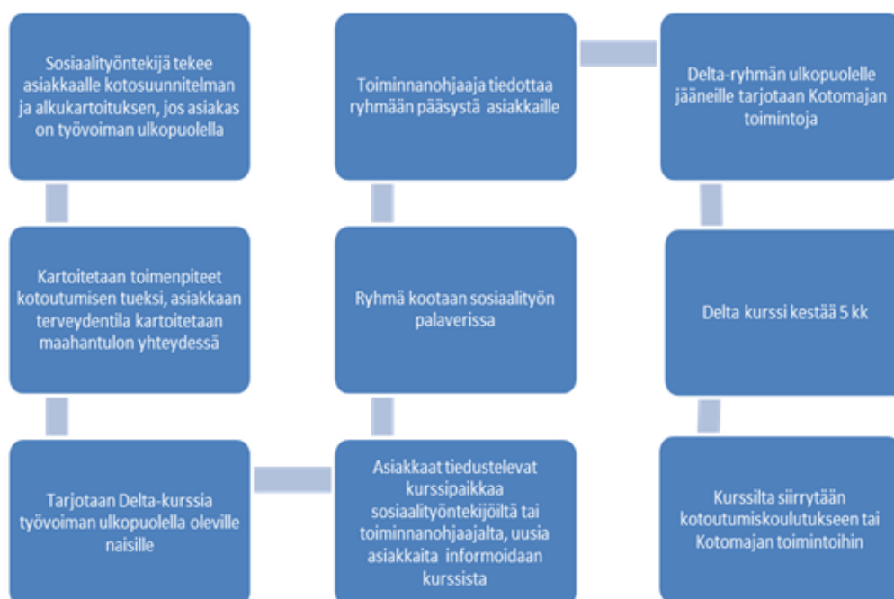
Kuvio 1. Asiakkaiden ohjautuminen Delta-kurssille.