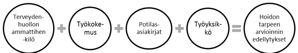
Kaavio 2. Hoidon tarpeen arvioinnin edellytyksen kriteerit (Lähde: Syväoja & Äijälä 2009, 27)

Hoidon tarvetta arvioitaessa selvitetään potilaan yhteyden oton syy, sekä sairauden oireet ja vakavuusaste, minkä kautta arvioidaan hoidon kiireellisyys potilaan esitietojen tai lähetteen perusteella (Valtioneuvoston asetus hoitoon pääsyn toteuttamisesta ja alueellisesta yhteistyöstä 1019/2004 § 2). Lääkärin ohella hoidon tarpeen arvioinnin voi toteuttaa muukin Valviran valtuuttama terveydenhuollon ammattihenkilö, esimerkiksi rekisteröity sairaanhoitaja, jolla on kokemusta hoidon arvioinnista toimintayksikössä (Kaavio 2) (Hoidon tarpeen arviointi erikoissairaanhoidossa. Kuntainfo 7/2006).