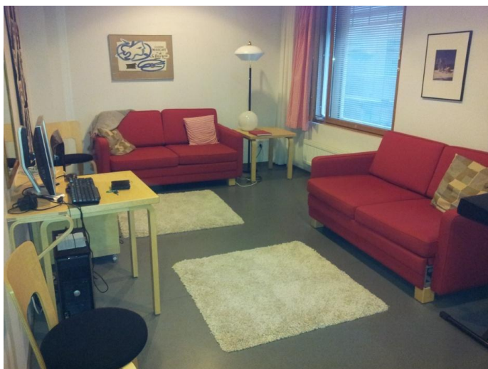
Figur 1. Seniorboendets gästrum fungerade som intervju utrymme. Helsingfors 2013.

Enligt Kvale & Brinkman (2009 s. 102-103) är intervjuens medium språket, men inte bara det verbala utan även det relationella och sådant som inte sägs är betydelsefullt, vilket av intervjuaren kräver tålmodigt lyssnande. Eftersom även transkriberingarna av intervjuerna skall uppfattas som levande samtal valdes att båda forskarna är med under intervjutillfällena för att se hela sammanhanget. (Kvale & Brinkman 2009 s. 208)