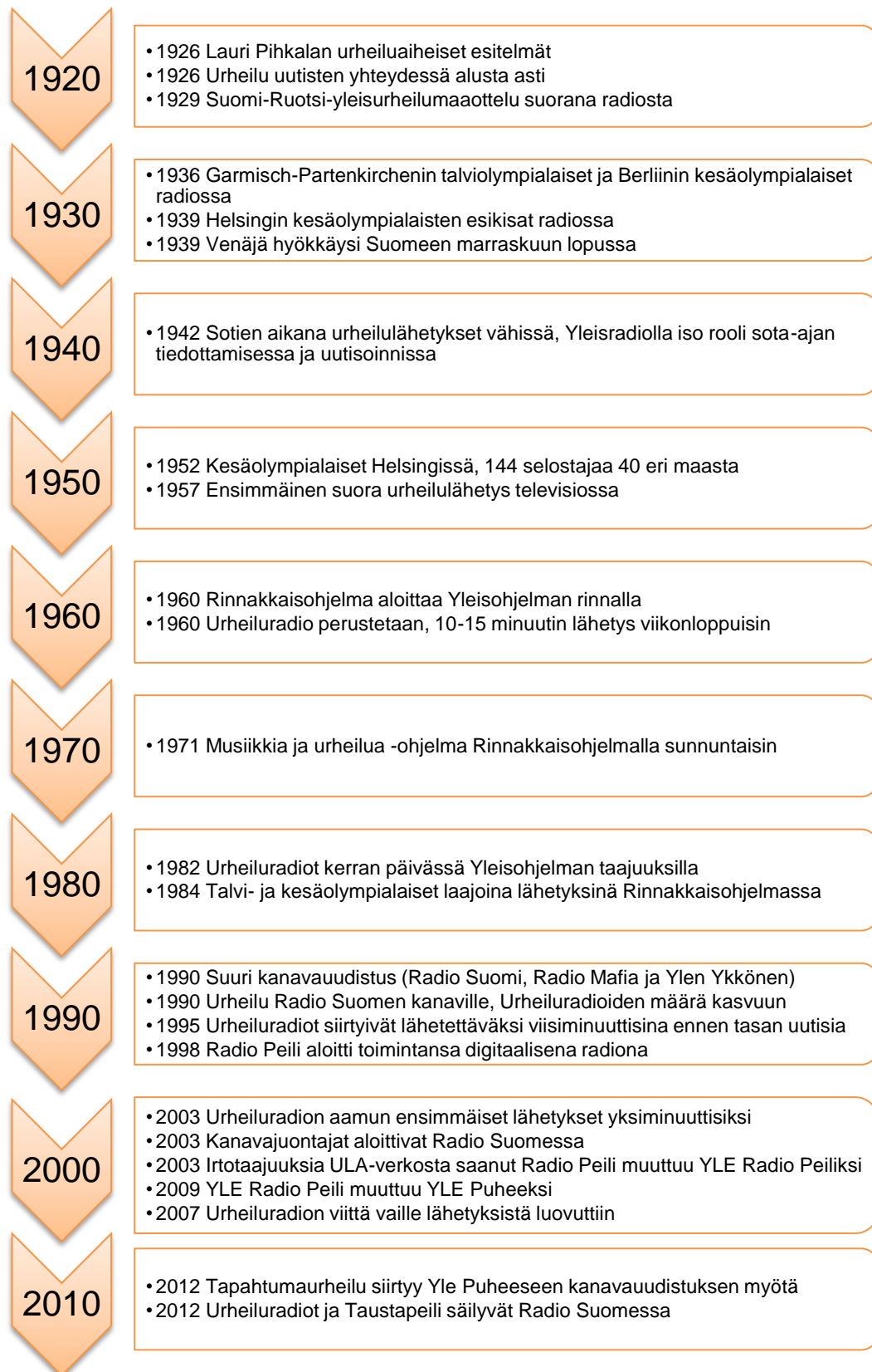
Kuvio 1. Yleisradion radiourheilun historian vaiheet vuosikymmenittäin.