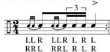
Kuva 1. The Standard 26 American Drum Rudiments.