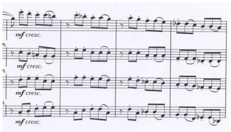
Kuva 3 c-mollijousikvartetton ensimmäinen osa

Eri sävyjen ja erilaisten artikuloititapojen hakeminen tuntui vievän paljon aikaa harjoituksissa. Teos on täynnä artikulaatiomerkitöjä, jotka ovat toisinaan hieman hämmäntäviä. Esimerkiksi ensimmäisen osan loppupuolella, tahdeissa 215 – 218, sello, alttovilu ja ensimmäinen viulu soittavat täsmälleen samalla tavalla rytmisesti, ja tahdeissa olevat kahdeksasosot on merkitty samalla tavalla pistein lukuun ottamatta kahta viimeistä ääntä, jotka on sidottu kaarilla. Kuva 3 havainnollistaa, kuinka esimerkin toisesta tahdistä lähtien kakkosviulun artikulaatio eroaa muiden instrumenttien linjasta.