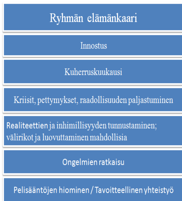
Kuvio 2 (Pellervo 2010, hakupäivä 13.10.2013.)

Osuuskunnassa ongelmaksi voi muodostua demokraattisuus, sillä ihmiset ovat erilaisia ja erimielisyyksiltä ei välttyä. Osuuskunnassa voi olla toimitusjohtaja, mutta osuustoiminnan arvojen mukaan päätökset tehdään silti demokraattisesti. Joskus päätöksenteko voi kuitenkin olla hankalaa ja jopa riitoja saattaa esiintyä. Osuuskunnassa pääoman määrä on jäsenten päätettävissä, joten siitä sopimisessa saattaa esiintyä erimielisyyksiä. Osuuskunnassa on yleensä useita jäseniä, jonka vuoksi on tärkeää pystyä keskustelemaan asioista, jotta ryhmä pystyy toimimaan jatkossakin. On kuitenkin selvää, että kun yritys toimii ryhmänä, ongelmilta ei voi välttyä. Yleisestikin voidaan sanoa, että ryhmillä on yleensä tietynlainen elämäнкаari (kuvio 2), vaikka tietenkin myös poikkeuksia on. (Pellervo 2010, hakupäivä 13.10.2013.)