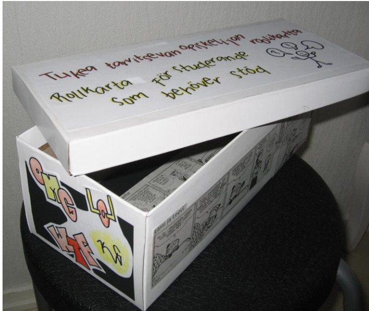
Kuva 1. Tukea tarvitsevan opiskelijan roolikartta; laatikon ulkoasu.

Kortteja säilytetään laatikossa (Kuva 1 ja liite 4), jonka ulkoasun tavoitteena on herättää uteliaisuutta ja henkiä nuorten ajatusmaailmaa. Laatikko on kierrätetty ja siinä on erillinen kansi, jossa lukee roolikartan nimi suomeksi ja ruotsiksi. Laatikon sivuilla ja pohjalla ovat sarjakuvat on leikattu vanhoista sanomalehdistä, ne kuvaavat eri tavoin nuorten elämää ja sopivat siksi aiheeseen. Laatikon tekstit on kirjoitettu itse.