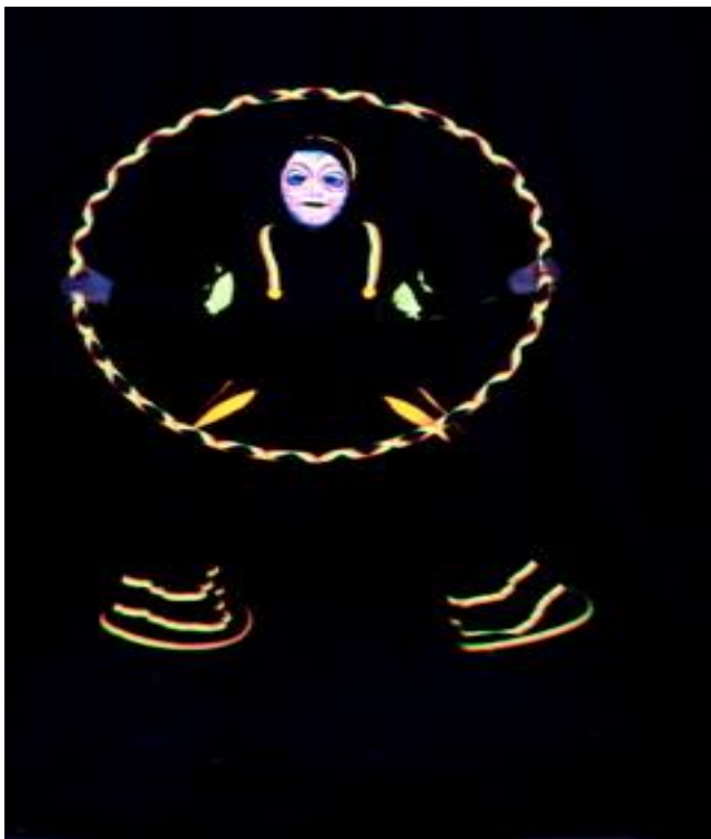
KUVA 1. Mustavalo

Mustavalo on vaaratonta, pitkäaaltoista ultraviolettivaloa, joka saa fluerosoivat aineet säteilemään näkyvää valoa eli ”hohtamaan”, esimerkiksi valkaistun paperin ja kankaan, hampaat ja neonvärit sekä muut pimeässä loistavat materiaalit. Näkyäkseen ultraviolettivalo tarvitsee mustavalolampun, joita käytetään paljon teattereissa. Ainoastaan mustavalolampun valaisemat fluerosoivat materiaalit näkyvät. Normaali värimaailma katoaa näkyvistä ja välittyy katsojalle täysin mustana. (Carver, 2013, 283; Walne, 1995, 109)