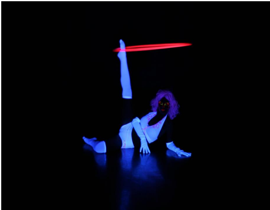
KUVA 9: Ennen kuvakäsittelyä