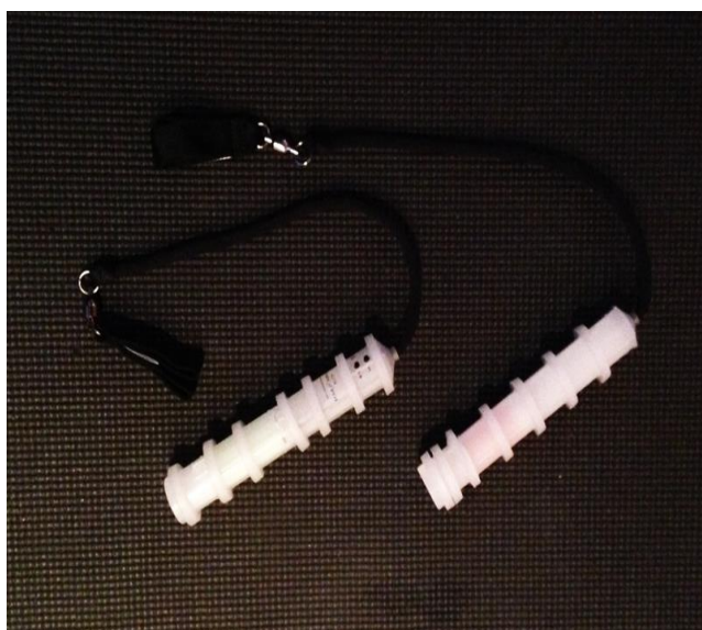
KUVA 7. LED-poit

Pixel-poinumero on kaikkien esiintyjien yhteinen numero, joka on oivallinen varieteen lopetuskappale. Globus -yhtyeen ”Electric Romeo” -kappaleeseen tekemäni koreografia vuonna 2011 on nopea, mahtipontinen sekä näyttävä numero, jossa päävuoron saavat led-valoa käyttävät pixel-poit. Väline on noin 30 cm mittainen led-poi ja sitä pyöritetään samalla tavalla kuin normaaliakin poita eli väline per käsi. Pixel-poihin on mahdollista ohjelmoida yrityksen logo, tekstejä sekä kuvioita, mikä tekee siitä erinomaisen lisän varieteen numeroihin. Numeron kokonaiskesto 2 minuuttia 15 sekuntia.