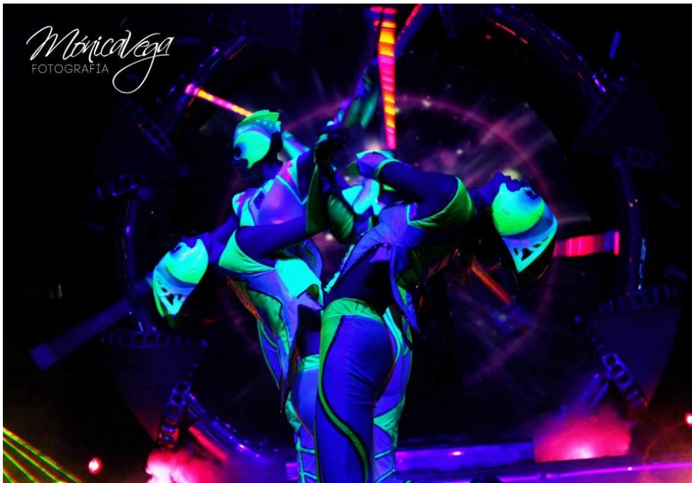
KUVA 1: Ilussion Fuego y Magia, Meksiko

Haluan kertoa muutaman sanasen kokemuksestani mustavaloesityksissä, sillä täysin kokemattomana en esitystäni lähtenyt suinkaan rakentamaan. Viimeisen kolmen vuoden aikana olen ulkomaiden showproduktioissa huomannut mustavaloesitysten kasvattavan kiihtyvällä tahdilla suosiotaan ympäri maailmaa. Vuonna 2012 olin Meksikossa Ilussion Fuego y Magia -produktiossa mukana kuusi viikkoa. Esitys kesti kerrallaan tunnin ja päivään esityksiä mahtui kolme, kaiken kaikkiaan yhteensä 75 . Työnkuvaani kuului esityksen päälaulajana toimiminen sekä esiintyminen eri välineillä sirkusesitysten ryhmäkoreografioissa. Keväällä 2013 olin yhteensä kolme kuukautta Turkin Antalyassa vastaavanlaisessa produktiossa. Kumpikin edellämainittu produktio sisälsi myös mustavalo-osuuksia. Jo vuonna 2011 miljonäärin luksushäissä Israelissa esiinnyimme Eros Ramazottin ja Vanessa Maen esitysten välissä mustavaloesityksellä. Urani huippuhetki mustavaloesiintyjänä oli kuitenkin syksyllä 2013 Pietarin G20 –maiden huippukokouksessa, jossa esiinnyimme kahdenkymmenen rikkaimman teollisuusmaan johtajille. Upea show sisälsi myös mustavalo-osuuksia.