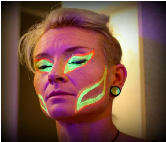
KUVA 8. Mustavalomaskeeraus

Maskeeraussuunnitelmani tein pitkälti vaatteiden väriytyksen mukaan. Femme´ Flowlle ja Duo Minjalle maskeerataan voimakas silmämeikki keltaisella ja pinkillä värillä, jotta silmät erottuvat. Poskiin piirretään kauniit tribaalit ja huulet maalataan hohtavalla pinkillä. Unitolle sekä Duo Flowlle tehdään koko kasvoihin voimakkaat ja graafiset tribaalit. Unitolla käytetään väreinä keltaista sekä pinkkia ja Duo Flowlle valitsimme ryhmän kanssa keltaisen ja oranssin.