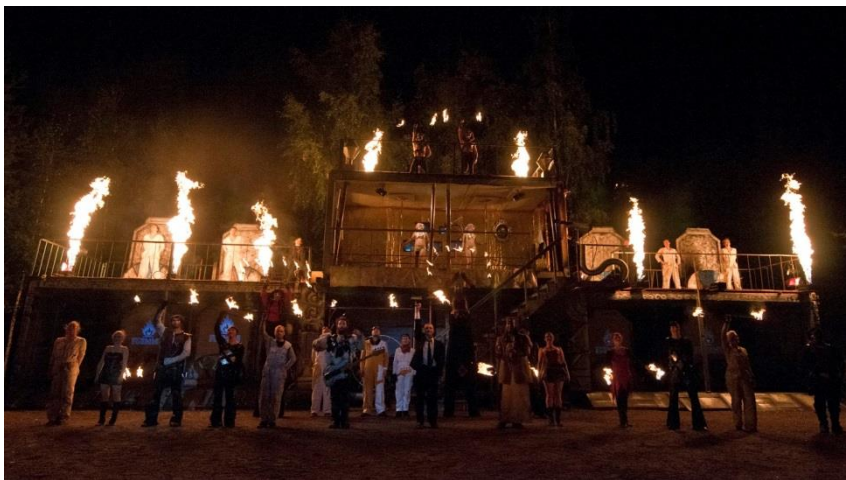
KUVA 2: Väinämöinen palaa

Suomessa olen työskennellyt Tuliryhmä Flammassa vuodesta 2008 lähtien. Flamman erikoisuutena oli jokavuotinen tuliteatteri, joka järjestettiin vuosina 2007-2012 syksyisin Pyynikin kesäteatterissa aina 12 näytöksen voimin. Näytös oli joka vuosi noin tunnin mittainen ja se yhdisteli tuli-, sirkus-, tanssi-, näyttämö-, ja valotaidetta. Mustavaloteatteria sisältäviä produktioita olivat muun muassa ”Narrien Uni”, ”Lemminkäisen Temppele” sekä ”Väinämöinen palaa”.