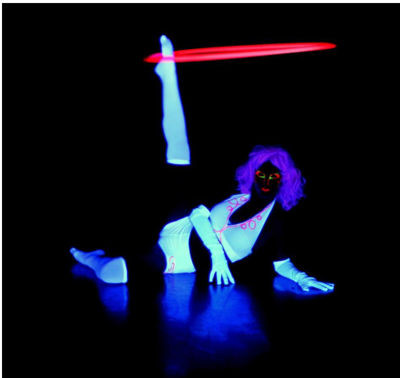
KUVA 10: Kuvakäsittelyn jälkeen