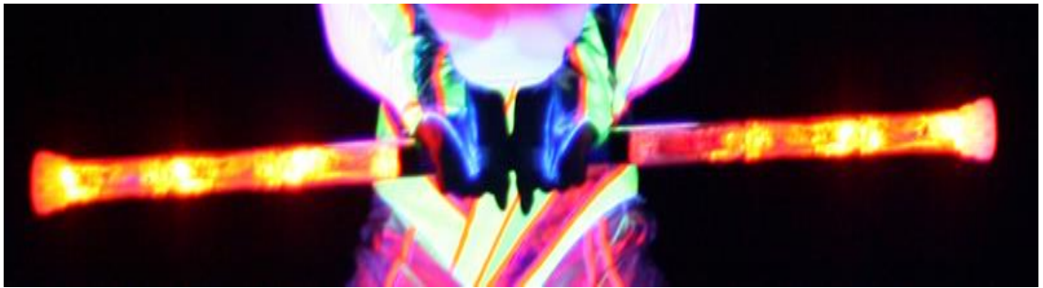
KUVA 4: LED-keppi

Keppinumerot toimivat todella hyvin mustavalossa, mutta vaativat tilalta enemmän korkeutta kuin muut numerot, mikä on hyvä huomioida esitystä myytäessä. Mikäli tilaa ei täysin saada pimennetyksi, voidaan keppinumerot tehdä Flowtoys-ledvalo –kepeillä, joissa loistavat kirkkaasti oranssit sekä vihreät ledvalot ja mustavalo on mukana tuomassa esiin esiintyjän profiilin sekä vaatetuksen.