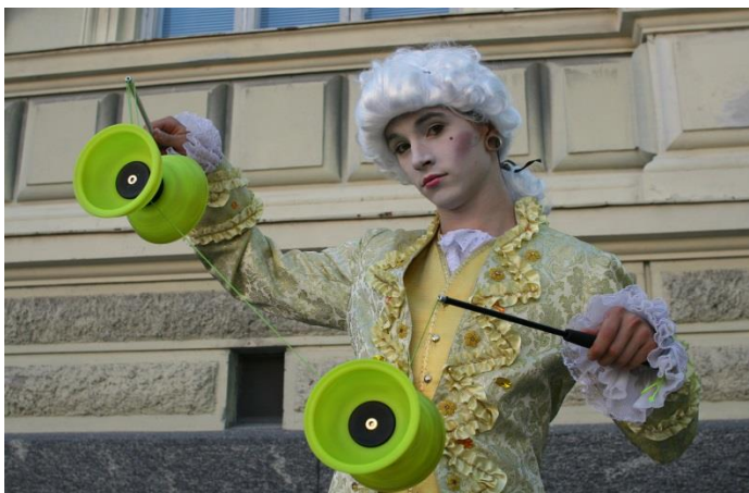
KUVA 3: Diabolo

Diabolo on tiimalasin muotoinen hyrrä, jota pyöritetään kahden tikun väliin kiristetyllä narulla. Kun hyrrää vauhditetaan sopivalla vauhdilla, säilyy sen tasapaino narulla ja mahdollistaa erilaisten tempujen tekemisen. Diaboloja on erikokoisia, erivärisiä, eri materiaaleista tehtyjä ja erilaisiin tarkoituksiin suunnattuja muun muassa tulidiabolo. Mustavalossa väline erottuu kuitenkin parhaiten, kun naru, tikut sekä diabolo itsessään ovat uv-hohtoisia.