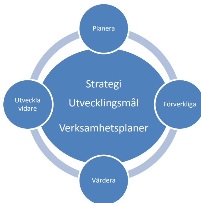
Figur 3. Utveckling av verksamheten (Kvalitetsplan för Utbildningstjänsterna i Borgå 2011)

Bakgrunden till kvalitetskriterierna är en organiserad utveckling av verksamheten (Figur 3):