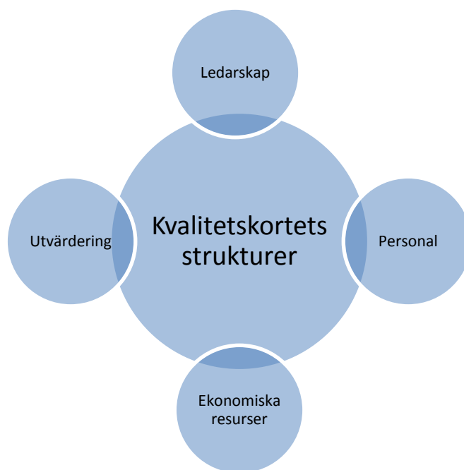
Figur 1. Kvalitetskortets strukturer (Kvalitetskriterier för den grundläggande utbildningen, morgon- och eftermiddagsverksamheten inom den grundläggande utbildningen och för skolans klubbverksamhet 2012)

Kvalitetskorten är fyra till antalet och de visar strukturerna inom följande områden (Figur 1):