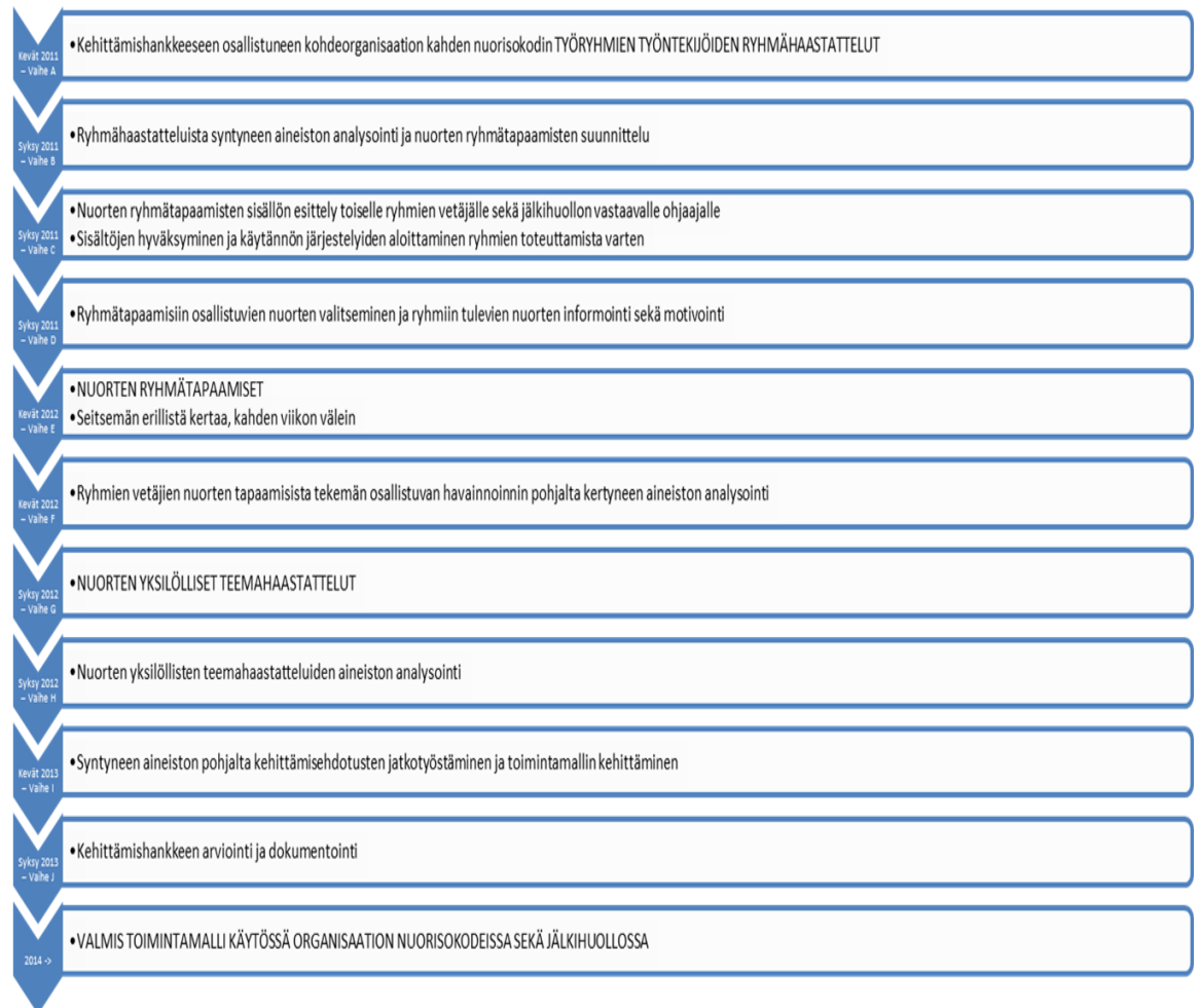
KUVIO 1. Kehittämisen eteneminen