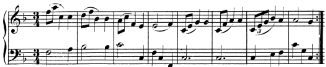
Kuva 1: Alku W. A. Mozartin kappaleesta Menuetti F-duuri (KV 2)

Esimerkiksi Mozartin pienten menuettien rakennetta voi käydä yksityiskohtaisemminkin läpi, fraasien tai jopa tahtien tasolla. Usein näytän oppilaalle, kuinka Mozart ”kyllästyy” jo omaa keksintöönsä - lyhyeen fraasiin - ja hieman muokkaa sitä seuraavassa fraasissa tai tahdissa erilaiseen muotoon, jossa kuitenkin samat elementit ovat pohjana. Mozart saattaa vaihtaa kuvion ylhäältä alaspäin laskevaksi, muuttaa kaaret staccatoiksi tai kahdeksasosot trioleiksi tai muuta pientä vivahte-eroa. Näin esimerkiksi W. A. Mozartin pienessä Allegrossa B-duuri, KV 3 sekä Menuetissa F-duuri, KV 2 (ks. kuva 1). Säkeiden loppuissa olevista pidätyksistä käytän usein mielikuvaa riidasta (pidätyksestä, joka on riitasointu) joka sovitaan (kun se purkautuu).