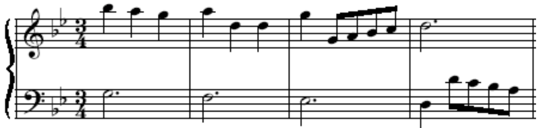
Kuva 2: C. Petzold: Menuetti g-molli (BWV Anh. 115)

Opettaja: ”Mitä sinulle tulee mieleen tästä intervallista?”