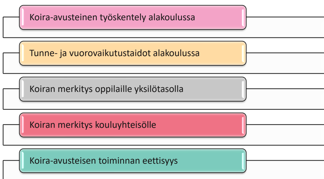
KUVIO 1. Teemahaastattelun teemat

Valitsin teemahaastattelun menetelmäksi, koska se kulkee haastattelijan laatimien teemojen äärellä, antaen kuitenkin haastateltavalle vapauksia vastata omasta näkökulmastaan aiheisiin. Valmiit teemat auttavat tämän opinnäytetyön luotettavuudessa, sillä valmiiksi laadittujen teemojen kautta varmistetaan se, että haastattelija sekä haastateltava pysyvät aiheen vaatimissa rajoissa ja tarkastelevat aihetta tähän opinnäytetyöhön tarkoitettulla tavalla (kuvio 1). Teemahaastattelu vaatii haastattelijalta perehtymistä aiheeseen ja vahvaa tiedostamista teemoittelun tarkoituksesta (Saaranen-Kauppinen & Puusniekka 2006).