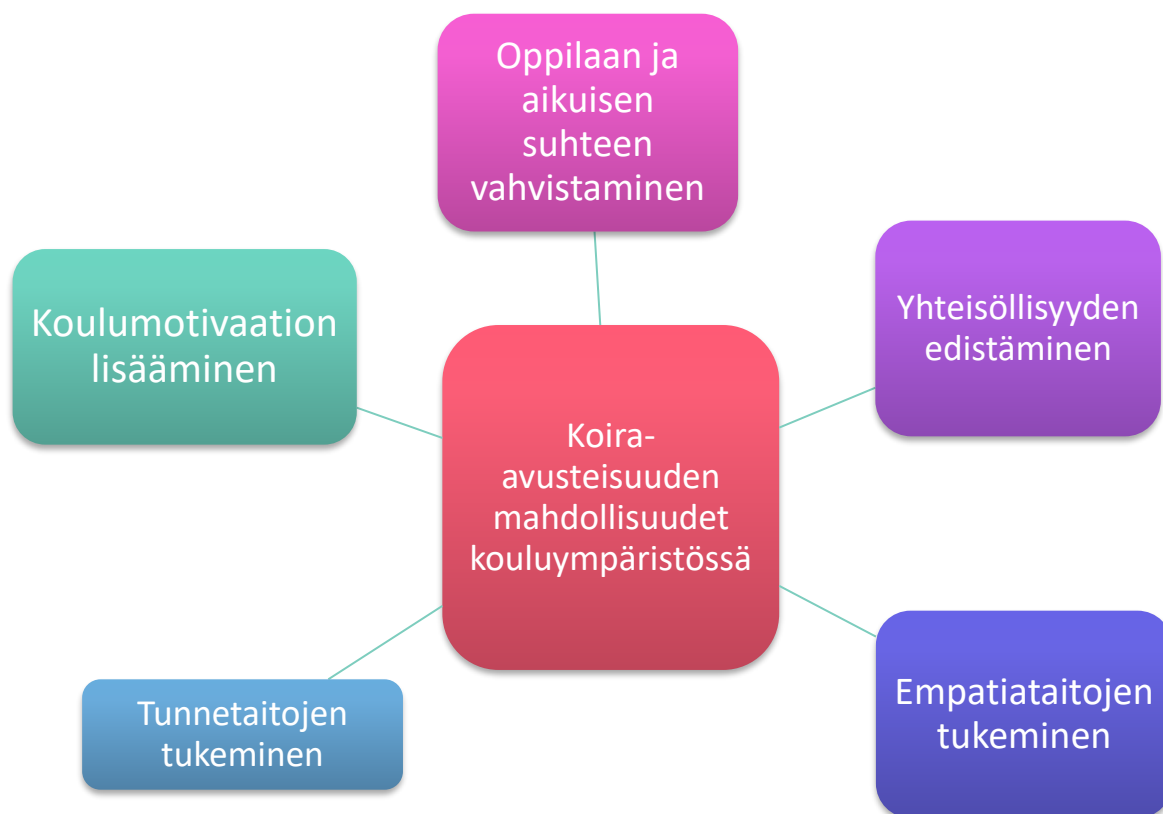
KUVIO 4. Koira-avusteisuuden mahdollisuudet kouluympäristössä.

Oppilashuollon työntekijä A: Toivon ja uskon, että se mitä me teemme koiran kanssa niin kantaa tulevaisuudessakin näitä lapsia.