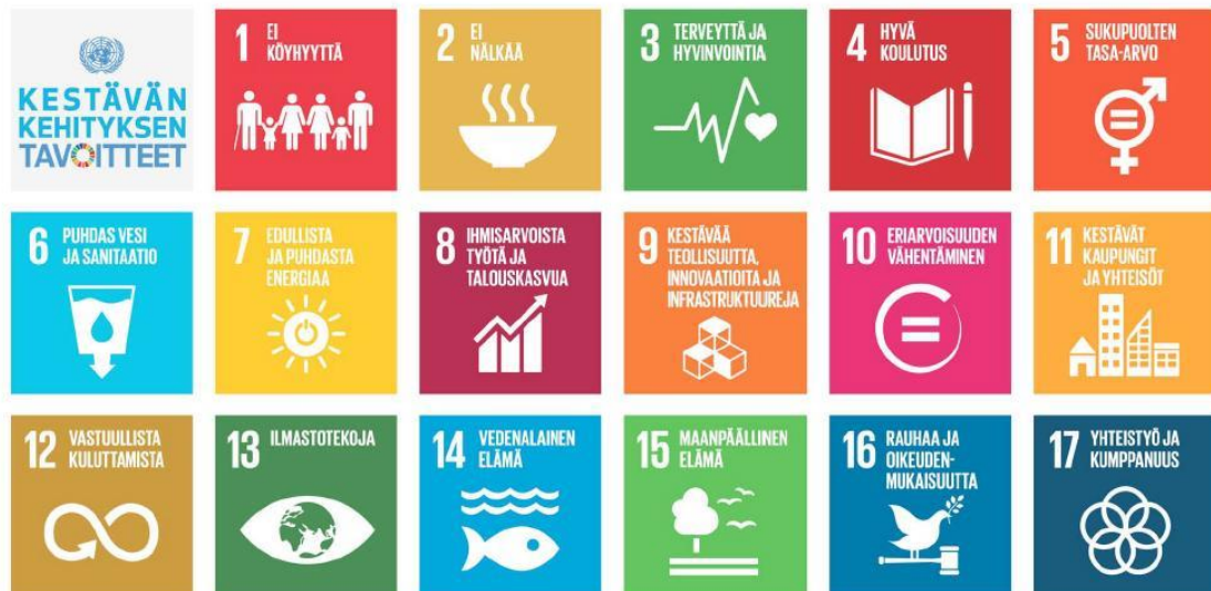
Kuva 1. Agenda 2030 tavoitteet (Koivuranta 2016).

Yhdistyneet kansakunnat ovat luoneet Kestävän kehityksen tavoitteet, joiden tulisi toteutua vuoteen 2030 mennessä. Tavoitteita on yhteensä 17 ja niitä kutsutaan myös nimellä Agenda 2030. (UNDP 2021.) Agenda 2030 tavoitteena on poistaa äärimmäinen köyhyys ja kohentaa kestävästä kehitystä maailman laajuisesti. Agendassa otetaan huomioon ihminen, ympäristö ja talous. (Suomen YK-liitto 2021c.) Tavoitteet ovat keskinäisriippuvaisia, koska edistäessä jotain tavoitetta tulee ottaa huomioon myös muut tavoitteet, etteivät ympäristöllinen, taloudellinen tai sosiaalinen kestävyys kärsisi tehdessä toimenpiteitä jonkun tavoitteen edistämiseksi. Kestävän kehityksen tavoitteet ovat kaikille maille samat, mutta eri asiat painottuvat eri maissa riippuen maan kehitystasosta. (Kestävä kehitys n.d.) Alla olevasta kuvasta näkyvät Agenda 2030 kestävä kehityksen 17 tavoitetta.