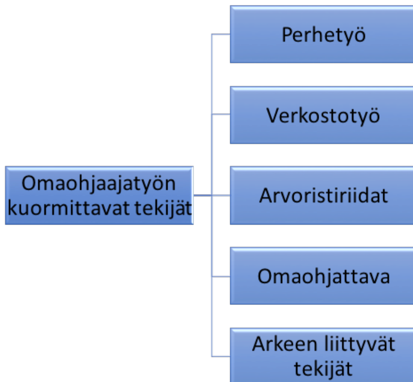
Kuvio 1. Omaohjaajatyön kuormittavat tekijät

Ohjaajat kuvailivat omaohjaajatyön kuormittaviksi tekijöiksi perhetyön, verkostotyön, arvoristiriidat sekä omaohjattavaan lapseen ja arkeen liittyvät haasteet (ks. Kuvio 1). Perhetyön kuormittavuus näkyi tutkimuksessa vanhempien sitoutumattomuutena yhdessä asetettuihin tavoitteisiin