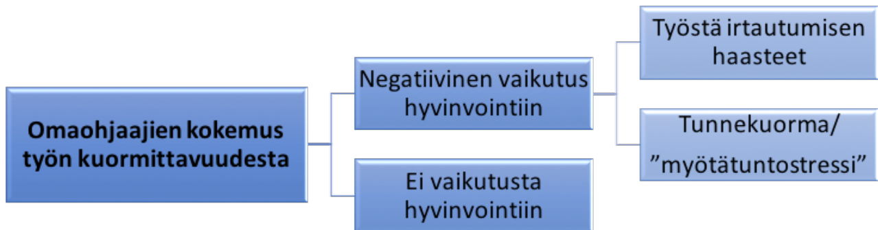
Kuvio 2. Omaohjaajien kokemus työn kuormittavuudesta

Omaohjaajien kokemus työn kuormittavuudesta (ks. Kuvio 2) jakautui kahteen pääteemaan: toiset kokivat kuormittavuuden vaikuttavan mm. lisäen työn tunnekuormaa ja vaikeutena työstä irtautumisessa, kun taas toiset eivät kokeneet kuormituksella olevan mitään vaikutusta heidän hyvinvointiinsa. Työstä irtautumisen haasteet koettiin esimerkiksi työasioiden pohtimisella vapaa-ajalla ja töiden seuraamisella kotiin. Omaohjaajien tunnekuormaa lisäsivät haastavat suhteet omaohjattavan lapsen vanhempien kanssa, lapsen haastava ja epäoikeudenmukainen tilanne sekä jatkuva paineen ja tarkkailun alla työskentely.