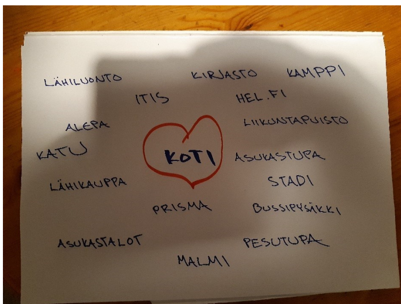
Kuva 6. arkikartta

Elettävyyteen liittyvää negatiivista palautetta tuli liittyen keskeneräisyyteen pihoilla, asuinalueella ja yhteisten tilojen varustelussa. Elettävyyteen liittyvät tekijät