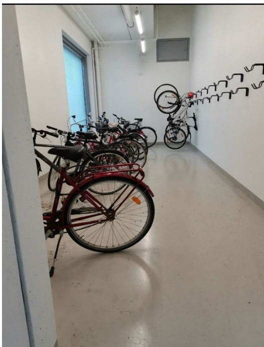
Kuva 3. Pyörävarasto