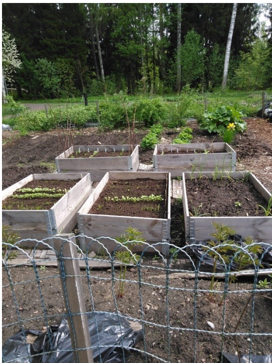
Kuva 5. Palsta-alue