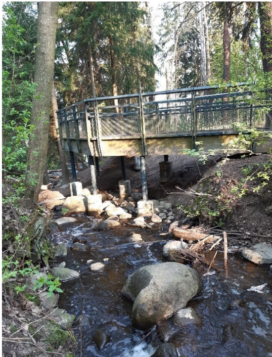
Kuva 4. Viikinoja

keskeinen sijainti. Viherympäristöjen merkitys näkyi haastatteluiden lisäksi valokuva-aineistossa. Kaikki neljä kuvaa toimittanutta tutkittavaa olivat kuvanneet viherympäristöjä jossain muodossaan. Kuvissa näkyivät pihojen istutukset, lähiluonto metsineen ja puroineen (kuva 4), meri, läheinen palstaviljelmäalue (kuva 5) ja Alppiruusuipuisto. Lähiluontoa kuvailtiin kuvien yhteydessä isoksi rikkaudeksi, puron solinaa rentouttavaksi kuunneltavaksi (kuva 4) ja pihan istutuksia todella kauniiksi ja kotoisuutta luoviksi. Vain kaksi haastatelluista toimitti pyydetyt arkikartat. Näissä kahdessa kartassa näkyi asukkaiden liikkuminen arjen paikoissaan, kuten talon yhteisissä tiloissa, lähiluonnossa ja lähikaupoissa (kuva 6). Valokuvista ja arkikartoista kävi myös ilmi, että ihmisille merkittäviä arjen paikkoja voivat olla myös hieman kauempana kotoa sijaitsevat paikat.