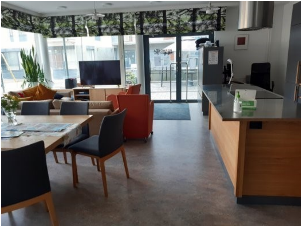
Kuva 1. Asukastila

Asukastoimikunnalla on kerran kuussa kokouksia, välillä ne on avoimia, välillä ei, mutta aina avoimet kokoukset järjestetään kuukaudessa ja sit meil on kaiken maailman kevättapahtumia, syksytapahtumia, järjestetään kokouksia, paistetaan makkaraa sen jälkeen ja nytkin talkoita on järjestetty ja sit on kaiken maailman kierrätysviikkoja järjestetään asukastupaan, jotta ihmiset saa kierrättää vanhoja vaatteita tai mitä hyvänsä siellä. Se on erittäin positiivista.