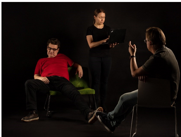
Kuva 1. Ohjaaja näyttämöllä tulevaisuusteatterin esityksessä.

esityksen pohjana on etukäteen harjoiteltu rakenne, mutta toteutus pitää sisällään mahdollisuuden improvisaatioon. Työn murroksesta kertovan näytelmän alussa kysymme yleisöltä, millaisia näkemyksiä sillä on aiheeseen liittyen. Pyrimme ottamaan näitä näkemyksiä huomioon esityksen aikana sekä sanallisesti että toiminnallisesti. Esityksessä yhdistellään myös postdraamalliseen teatteriin liitettävää läpinäkyvyyttä ja keskeneräisyyttä. Tämä näyttäytyy näytelmään sisältyvissä siirtymissä, joissa yksi näyttelijä ottaa vuorollaan näkyvän teatteriohjaajan roolin ja vie esitystä eteenpäin harjoituksenomaisesti (kuva 1).