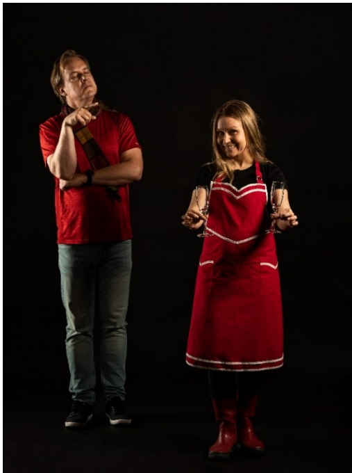
Kuva 2. Systeemin säännöt ja yrittäjä tulevaisuusteatterin esityksessä.

Kuva 2 on tulevaisuusteatterin ensimmäisestä, kaupunkien tulevaisuuksia kuvaavasta näytelmästä. Siinä mieshenkilö esittää systeemiä ja systeemin sääntöjä, joiden puitteissa etualalla oleva yrittäjä luovii ja ansaitsee elantoaan.