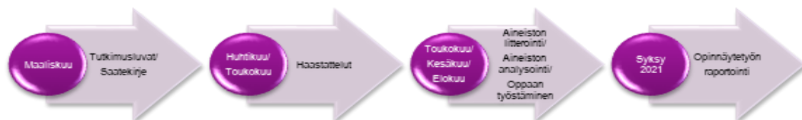
KUVIO 3. Suunniteltu aikataulukana.

Opinnäytetyön suunnitelman kirjoittaminen aloitettiin loppusyksystä 2020. Haasteeksi osoittautui teoreettisen viitekehyksen muodostaminen. Turvataitokasvatuksen perusta on kirjattu perustuslakiin. Lisäksi monet muut lait ja standardit ohjaavat turvataitokasvatusta. Turvataitojen tarve kumpuaa valitettavasti erilaisista lieveilmiöistä. Pohdittava oli, että kuinka laajasti ja mitkä kaikki asiat tuotaisiin esille opinnäytetyössä. Aiheen spesifyden takia kansainvälisiä tutkimustuloksia turvataitokasvatukseen oli haastavaa löytää, vaikka tiedonhakuja varten useita hakusanoja oli mietitty etukäteen. Tiedonhakuun käytettiin laajasti eri tietokantoja, kuten Pubmed, Medic, Ebsco ja Duodecim. Lähteiksi pyrittiin löytämään tuoreita, maksimissaan viisi vuotta vanhoja tutkimuksia. Laadullisen tutkimuksen ja projektityöskentelyn menetelmäkijallisuuden osalta hyväksyttiin myös vanhemmat julkaisut. Alun kankeuden jälkeen opinnäytetyönsuunnitelma eteni nopeasti ja valmistui maaliskuussa 2021. Kuviossa 3 on nähtävillä opinnäytetyölle suunniteltu aikataulukana.