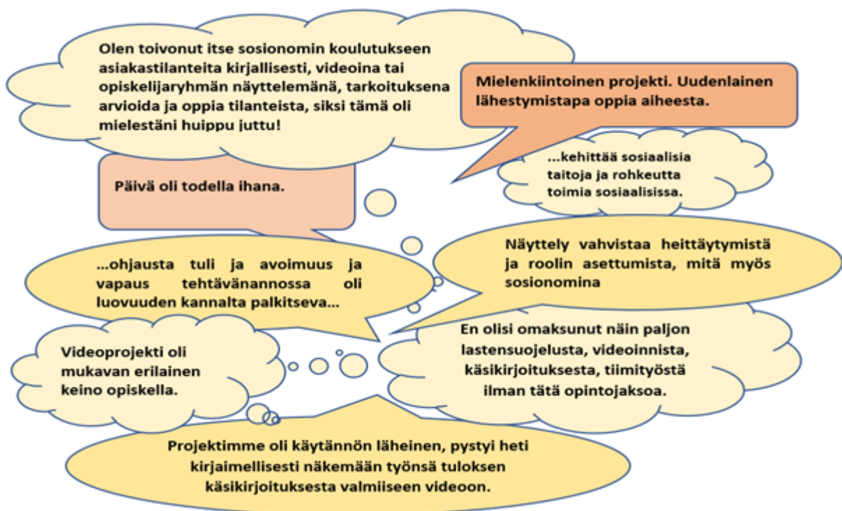
KUVIO 1. Opiskelijapalautteet (kuvio: Mira Schroderus)

Opiskelijat kommentoivat projektia, siihen liittyvää ohjausta ja videointipäivää erittäin positiivisesti ja kommentteista paistoi tyytyväisyys heidän oppimaansa (kuvio 1).