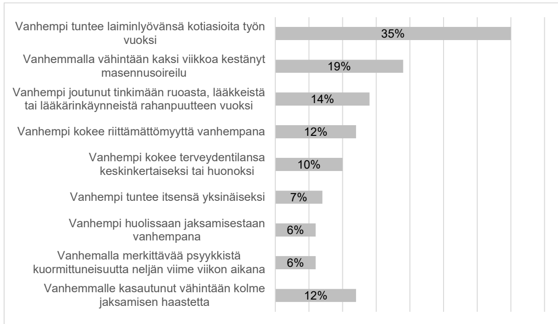
Taulukko 1. Nelivuotiaiden lasten vanhempien (N=10 737) jaksamisen haasteet vanhempien raportoimana, % vanhemmista, jotka vastasivat kyselyyn

Suomen evankelis-luterilaisella kirkolla on linjauksia lasten, nuoren ja perheiden tueksi. "Että kukaan ei jää yksin" -suuntaviivat ovat lähtöisin kirkon erityisnuorisotyöstä ja ne ehkäisevät ulkopuoliseksi jäämistä. Se läpileikkaa kaikki kirkon kasvatuksen työalueet, ja suuntaviivat hyväksyttiin kirkkohallituksessa. Kirkon kasvatustyö torjuu ulkopuolisuutta ja yksinäisyyttä. Lapsen, nuoren ja perheen ulkopuolisuutta torjutaan, jolloin tapahtuu voimistumista sekä vahvistetaan osallisuutta ja hyvinvointia. Ulkopuolisuuden ehkäisemissä tärkeää on kirkon työntekijän eli kasvattajan työote sekä asenne. Ulkopuolisuuden ehkäiseminen on perusta kasvatuksen ja diakonian työalueilla. Ulkopuolisuutta ehkäisemällä haetaan luottamusta ja yhteistyötä lasten, nuorten ja perheiden kanssa. Työotteesta kumpuaa myös perhelähtöisyys ja luottamuksen kautta varhainen tukeminen onnistuu. (Kirkkohallitus, 2021, s. 12.) COVID-19-pandemia on aiheuttanut huolta yhteiskunnassamme, joten on tärkeä ottaa huomioon syrjäytymisen riskit perheissä.