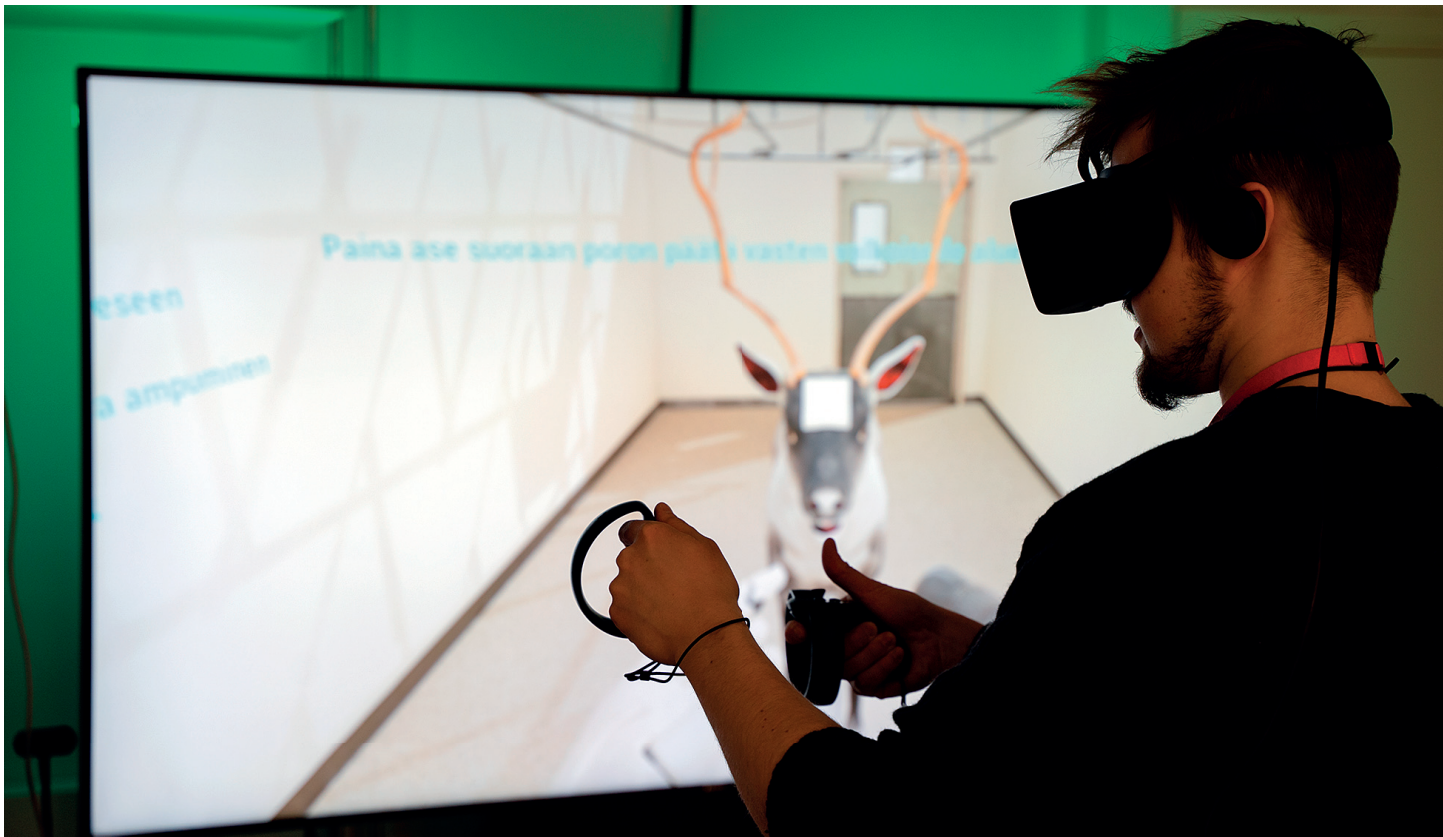
Virtuaaliteurastamokokonaisuudessa voidaan tehdä harjoitteita vr-laseilla teurastamoympäristössä.