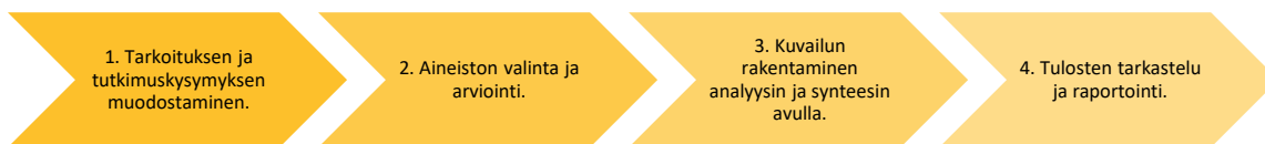
Kuvio 1. Kirjallisuuskatsauksen prosessivaiheet

mistä, syrjäytymistä, sijoitushistorian yhteyttä työllistymiseen sekä nuorten ja ammattilaisten kokemuksia itsenäistymisessä. Kirjallisuuskatsausten yhtenä tärkeimmistä tehtävistä on arvioida jo olemassa olevaa tietoa teorian pohjalta. Katsauksien avulla voidaan koostaa laaja kuva tietystä aihealueesta. Tutkimusmenetelmänä kuvaileva kirjallisuuskatsaus voidaan jakaa neljään eri vaiheeseen, joita havainnollistetaan kuviossa 1.