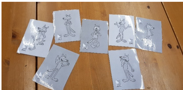
Kuvio 1. Tunnekortit startin alussa.

Alkuesittelyn, esitietolomakkeen täyttämisen ja sääntöjen luomisen jälkeen jokainen osallis- tuja sai kertoa minkälaiset fiilikset ovat tällä hetkellä. Fiiliksen kuvaamiseen käytettiin MAHTI-tunnekortteja. Pöydällä levitetystä korteista jokainen sai valita itselleen sopivan kor- tin. Jokainen myös kertoi omasta fiiliksestä esittelemällä kortin ja lyhyesti sanoittamalla sen. Alkufiilikset olivat kaikilla osallistujille myönteiset, muutamalla hiukan ihmettelevä tai häm- mentynyt kortti, yhdellä selkeästi peukut pystyssä. Kukaan ei valinnut surullista tai kielteisiä tunteita esittävää korttia. Sanoittamalla fiilisten kertominen on selkeästi haastavampaa, mutta korttien avulla sujui ihan hyvin.