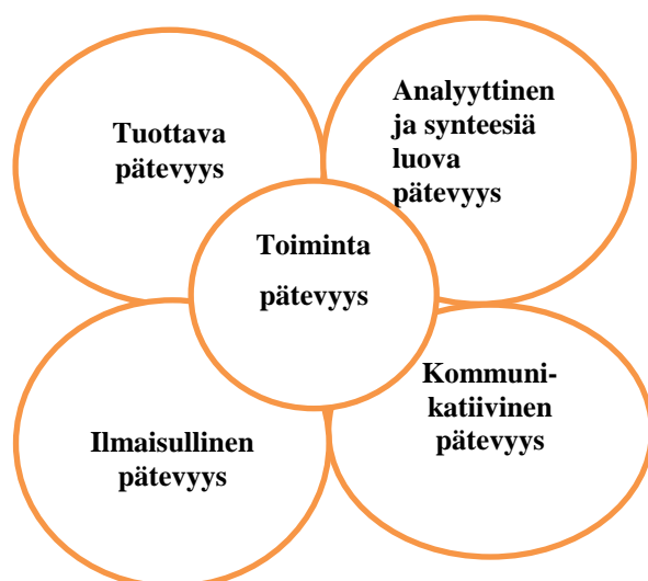
Kuvio 2. Sosiaalipedagogisesti suuntauneen ammattihenkilön pätevyysalueet Madsenin mukaan (Laiho 2005, 34).

tuottava pätevyys, ilmaisullinen pätevyys, kommunikatiivinen pätevyys sekä analyttinen ja synteesiä luova reflektiivinen pätevyys. Toimintapätevyys vaihtelee työntekijäkohtaisesti ja myös tilannekohtaisesti painottuen eri pätevyysalueisiin. (Ranne & Rouhiainen-Valo 2005, 30–31.) Tuottava pätevyys tarkoittaa työntekijän kykyä organisoida ja suunnitella työtään. Ilmaisullinen pätevyys pitää sisällään työntekijän kyvyn asettua toisen asemaan sekä sanallisesti että musiikin, draaman tms. kautta. Kommunikatiivinen pätevyys on työntekijän kykyä toimia yhteistyössä, solmia luottamuksellisia vuorovaikutussuhteita ja organisoida sosiaalista toimintaa. Analyttisen, synteesiä luovan pätevyyden avulla työntekijä jäsentää toimintaansa ja luo uusia toimintakäytäntöjä kokemansa ja tekemiensä johtopäätösten pohjalta. (Laiho 2005, 46–47.)