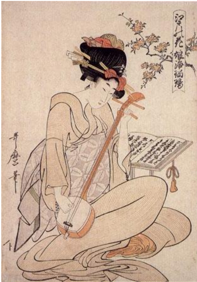
Kuva 8. Geisha soittaa shamisenia puupiirustuksessa.

Shamisenia käytetään enimmäkseen säestyksenä äänelle, ei niinkään sooloinstrumenttina. Shamisenin voi virittää sopimaan laulajan ääneen, koska sillä ei ole määrättyä perussävelkorkeutta. Bunrakussa shamisenin tarkoitus on tehostaa laulajan resitaatiota ja opastaa nukettajien liikkeitä. Shamisenin soittaminen kulkee myös suvussa, ja opettelu aloitetaan 7-8-vuotiaana. Kuten kaikkien taidemuotojen, shamisenin soittamisen oppiminen on rankkaa ja vaativaa. (Keene 1990,155 ) Opettelemisen vaikeuksia kuvaa esimerkiksi tämä tarina: ”Kerrotaan, että talvella eräs oppipoika pyysi hiilikamiinaa huoneeseen, sillä huoneessa oli jääkylmää ja kylmyys häiritsi soittamista. Ankara opettaja vastasi, että saat lämmittimen heti, kun olet oppinut soittamaan” (Eväsoja 2008, 62).