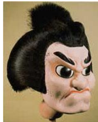
Kuva 26. Kintoki: miehekäs ja suvaitsevainen samurai (Bunraku Kyokai [viitattu 12.8.2009])