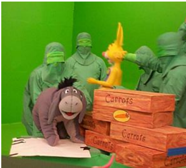
Vihreät nukettajat (Puppet wikia 2009 [viitattu 31.12.2009])