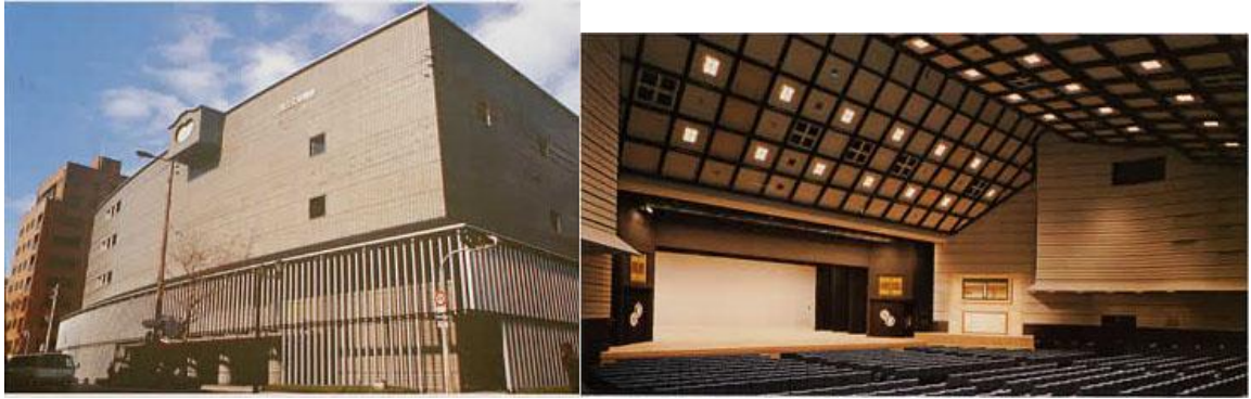
Kuvat 6. ja 7. Osakan kansallinen bunrakuteatteri ulkoa ja sisältä (Bunraku Kyokai 2004 [viitattu 14.11.2008])

nukenkäsittelijöitä. Japanin omaperäisen nukketeatteritaiteen arvo on ymmärretty myös maailmanlaajuisesti, sillä bunraku sai vuonna 2003 UNESCO:n maailmanperintösäätiön suojauksen. (Brand-New Osaka vol.8 2008 [viitattu 6.9.2009].)