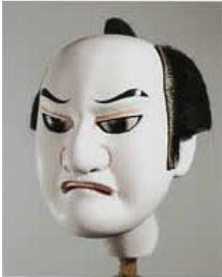
Kuva 27. Komei: syvämietteinen samurai, jolla on hienostunut ulkoasu ja salattu suru, nelikymppinen.