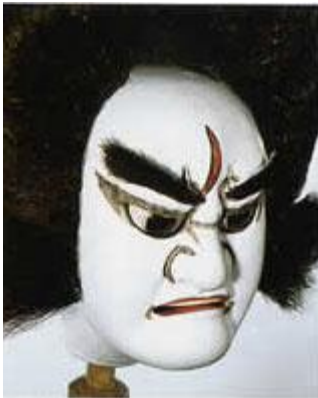
Kuva 16. Bunshichi: traaginen sankari, rohkeat, karskit, miehekkäät piirteet ja salattu suru.