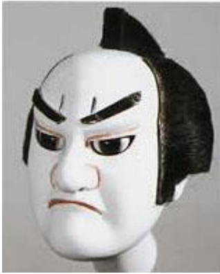
Kuva 14. Kenbishi: samurai, ronin (isännätön samurai) tai ritarillinen kyläläinen, voimakastahtoinen sivuhahmo. (Bunraku Kyokai [viitattu 12.8.2009])