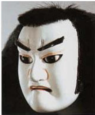
Kuva 29. Genta: komea ja aistillinen parikymppinen nuori mies.