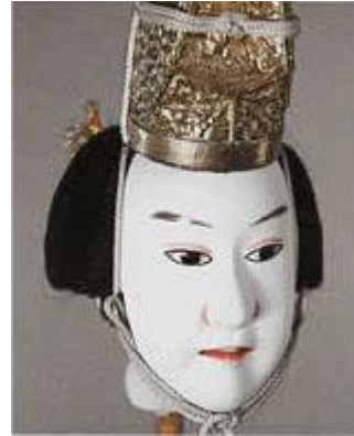
Kuva 28. Wakaotoko: komea teini-ikäinen nuori mies, usein toisen hahmon kiinnostuksen kohteena.