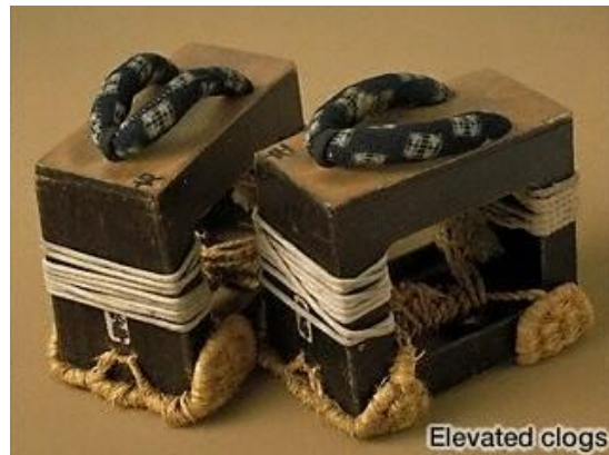
Kuva 11. Butai geta

Kaikki kolme nukettajaa ovat yhdessä lavalla nuken kanssa. Jotta heidän näkymisensä ei häiritsisi näytelmää, he ovat pukeutuneet mustiin kaapuihin ja huppuihin. Tätä asua kutsutaan nimellä kurogo eli tyhjyys. Kuuluisa päänukettaja, joka on yleisön suosikki, voi esiintyä ilman huppua. Alun perin bunrakussa nukettajat olivat kokonaan piilossa lavalle ripustetun verhon takana. Nukkeja pideltiin ilmassa, kuten käsinukkeja. Sonezakin rakkausitsemurha-näytelmässä nukettaja manipuloi naispääosanukkeä verhon edessä. Hänen sanotaan olleen niin komea, että siitä syntyi uusi ulottuvuus bunrakun visuaalisuuteen: näkyvä nukettaja. (The Japan Arts Council 2004 [viitattu 14.11.2008])