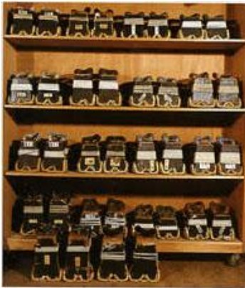
Kuva 10. Puukengät hyllyssään.

kymmenen kädessä, ennen kuin hän on tarpeeksi hyvä mestariksi ja pääsee käsiksi päähän ja oikeaan käteen. Oppimisaika kussakin ruumiinosassa saattaa kuitenkin tosiasiasa vaihdella. Pään nukettaja käyttää puukengiä ( butai geta ) helpottaakseen muiden nukettajien työskentelyä. Nukke on noin metrin pituinen, enimmillään 150 cm. Kenkien korkeus saattaa olla 20-50 cm. (The Japan Arts Council 2004, Bunraku Kyokai 2004 [viitattu 14.11.2008])