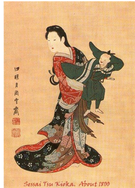
Kuva 5. Maalaus naisnukettajasta 1800-luvulta