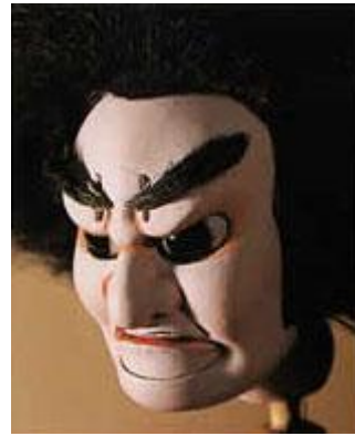
Kuva 15. Oodanshichi: jalomielinen sankari sivuroolissa.