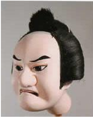
Kuva 21. Darasuke: pienen roolin pahis, omalaatuinen ja epämiellyttävä.