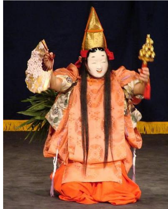
Kuva 2. Ama-no Uzumen Kagura-tanssi Iwatossa

Varhaisin Japanissa tunnettu teatterimuoto on kagura . Se on buddhalainen rituaalitanssi, jonka sanotaan olevan jumalatar Uzumen tanssista periytynyt. Kagura on saanut alkunsa Yamato-kaudella (300-700) ja ollut suosittua Heian-kaudella (794-1192).