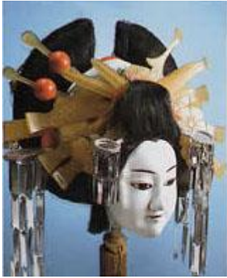
Kuva 23. Keisei: kaikkein pramein kashira, korkeimman luokan kurtisaani, hyvinkoulutettu, aistillinen ja itseään kunnioittava.