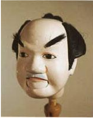
Kuva 19. Matahei: karkean rehellinen kylänmies