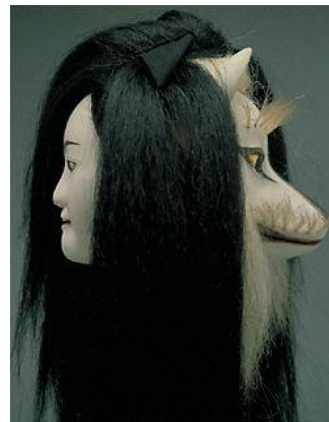
Kuva 30. Tamamo-no-mae: (kaksinaamainen) kun tätä päätä kääntää nopeasti, sillä voi esittää nuoren naisen muodonmuutoksen ketuksi ja toisinpäin. (Geshiedenis van Japan 2008 [viitattu 31.12.2009])