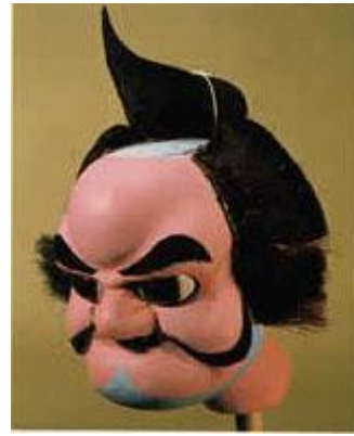
Kuva 20. Yokambei: hiukkasen humoristinen, sympatiat puolelleen saava pahis.