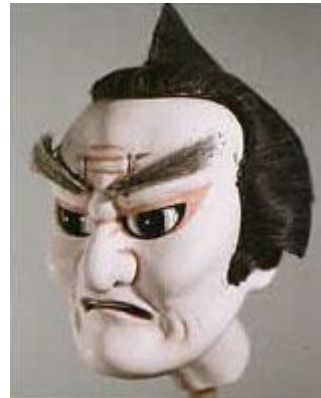
Kuva 18. Kiichi: vahva, suoraviivainen ja armollinen vanhempi samurai.