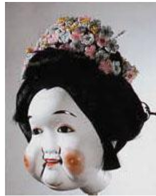
Kuva 22. Ofuku: koominen neito (Bunraku Kyokai [viitattu 12.8.2009])