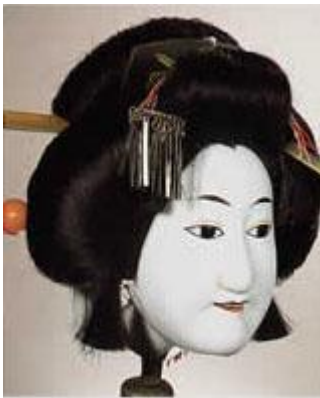
Kuva 25. Musume: suloinen tyttö tai nuori vaimo viiden- tai neljäntoista.