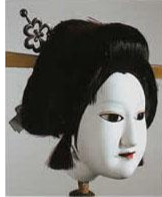
Kuva 24. Fukeoyama: nainen kahdenkymmenen ja kolmenkymmenen ikävuoden väliltä