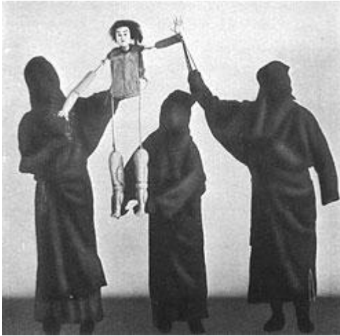
Kuva 9. Bunrakunuken riisuttu ruumis ja nukettajien asemat.

Yleensä nukkea käsittelee kolme ihmistä selkäpuolella sijaitsevista nuketuskepeistä. Pienemmissä rooleissa yksi riittää. Omo-zukai eli päänukenkäsittelijä ohjaa vasemmalla kädellään päätä ja oikealla oikeaa kättä. Pään sisällä olevien mekanismien avulla hän saa myös nukken ilmeen muuttumaan, kulmakarvat nousemaan, silmät liikkumaan tai suun auki. Hidari-zukai ohjaa vasenta kättä omalla oikealla kädellään ja vasemmalla hän käsittelee lavasteita. Jos on kyse isosta nukesta, hidari-zukai pitelee sitä lantiosta vasemmalla kädellään. Kokemattomin nukettaja on ashi-zukai , joka nukettaa jalkoja tai hametta. Hänen työasentonsa on kumara, jotta hän yltyä jalkoihin tai hameen alareunassa olevaan silmukkaan. Naisnukkea nukettaessa ashi-zukain nyrkit käyvät nukken polvista. ”Jalkahenkilö” joutuu myös tarpeen tullen tömistelemään omia jalkojaan nukken jalkojen ääneksi. Nukettajien täytyy toimia yhdessä ja kuunnella toisiaan, jotta nukke eläisi. Avustajien pitää mukaila mestarin liikkeitä. Heillä on koko ajan kosketus nukkemestarin vasempaan jalkaan. (The Japan Arts Council 2004 [14.11.2008])