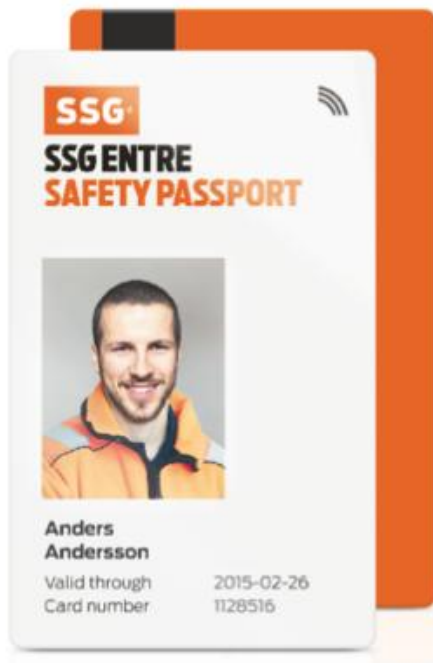
KUVA 6. SSG Entre -kortti

SSG -Entre kortti on ollut vuodesta 2010 yhteensopiva Suomen työturvallisuuskortin kanssa, joten kortin hankittuaan toisessa maassa, sitä ei tarvitse hankkia enää toisessa, jos päätyy sinne työskentelemään.