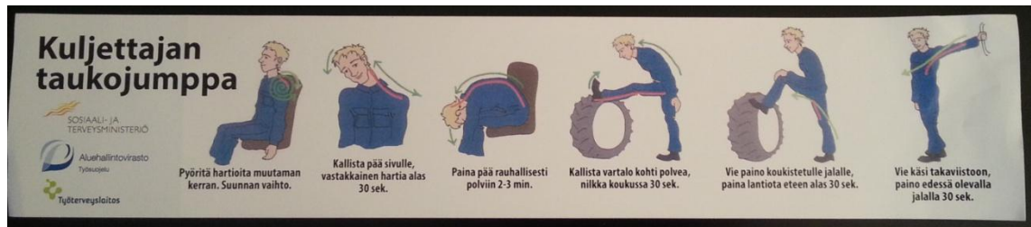
KUVA 4. Tarra metsäkoneen ikkunaan