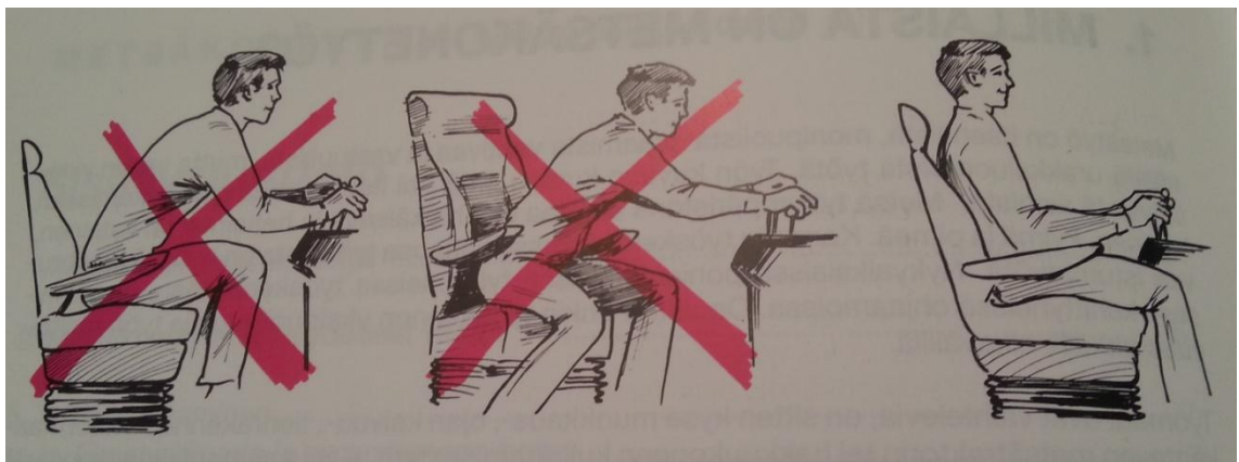
KUVA 3. Ohje oikeaan työskentelyasentoon (Tapola 2002)

Erityisesti työkoneella työskentelyn työhyvinvointiin on paneuduttu kuljettajien taukojumppaohjeistuksen avulla. Yhteistyössä sosiaali- ja terveysministeriön, aluehallintoviraston ja työterveyslaitoksen kanssa kehitetty "kuljettajan taukojumppa"- tarra (kuva 4) on hyvä esimerkki siitä miten pyritään pitämään työssä jaksamista edellyttävä ohjeistus jatkuvasti esillä kuljettajalle. Haastatteleman Koneyrityksien edustajan sanoin kyseisiä tarroja on mennyt todella paljon ja niitä olisi jatkossa tehtävä lisää. Hän kertoi minulle myös että kyseinen tarra on tyypillinen esimerkki siitä, että saman informaation voisi tehdä myös sähköisenä materiaalina ja se luultavasti olisi silloin havainnollisempi liikkuvine kuvineen, mutta silloin materiaali ei olisi näkyvissä jatkuvasti. Ideana on muistuttaa koneen ikkunassa kyseisestä jumpasta ja että se olisi syytä tehdä. Tietokoneelta löytyvästä sähköisestä materiaalista tuskin kovinkaan moni koneen kuljettaja rupeaisi kesken työpäivää etsimään ohjeistusta taukojumpan tekemiseen.