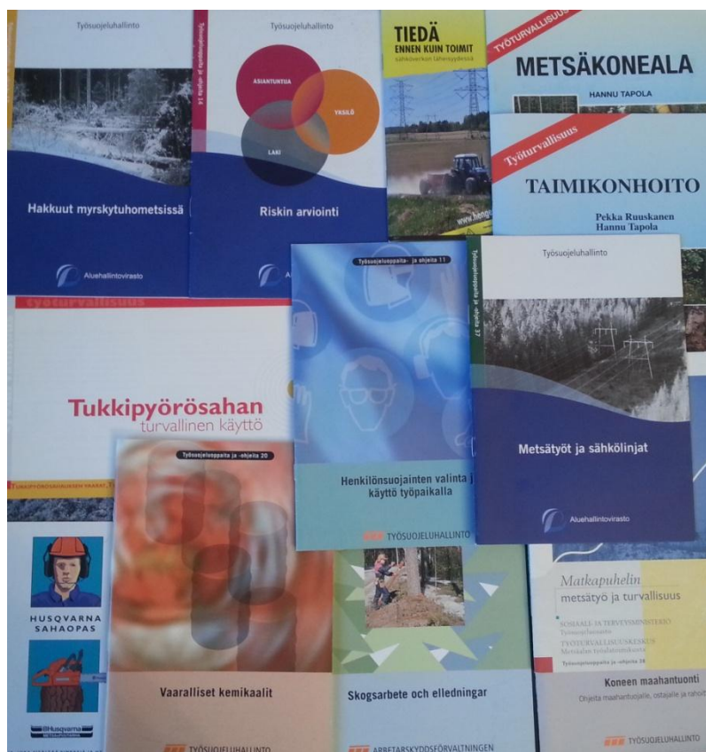
KUVA 1. Työturvallisuusesitteitä

Olen käynyt läpi useita työsuojeluoppaita (kuva 1), niin painettuja kuin sähköisiäkin, ja pyrkinyt siten saamaan kuvaa käytännön ohjeistuksen tilasta nykypäivänä.