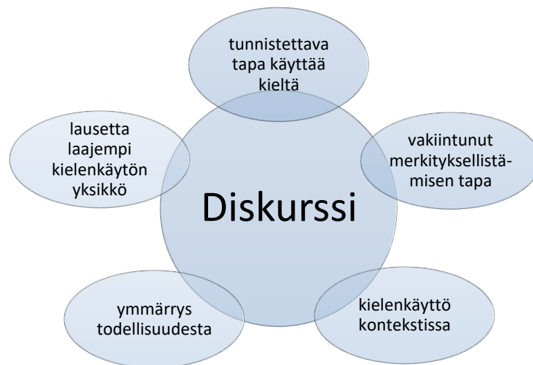
Kuva 1: Diskurssin käsite (mukaillen Pietikäinen & Mäntynen 2019, 28)

Representaatioon liittyy läheisesti diskurssin käsite. Diskurssit ovat ”representaatioita laajempia, suhteellisen vakiintuneita ajattelu- ja ilmaisutapoja, jotka liittyvät erilaisten yhteiskunnan instituutioiden toimintaan”, eli tietyn asian tai ilmiön ympärille rakentuneita tapoja puhua ja keskustella niistä, ja niillä viitataan useimmiten, joskaan ei aina, puhuttuun ja kirjoitettuun kieleen. Diskurssit eivät ole pysyviä, vaan ajasta ja paikasta riippuvaisia kielenkäytön tapoja, jotka ohjaavat käyttäjänsä ja vaikuttavat tämän luomiin representaatioihin. (Seppänen & Väliaverronen, 2012 103–105; Kuutti 2012, 26.) Kukin diskurssi kuvaa maailmaa hieman eri näkökulmasta, eli diskursiivisesta viitekehyksestä, käsin: esimerkiksi yksi ja sama ihminen voidaan merkityksellistää äidiksi, naiseksi, akateemiseksi, aikuiseksi, musiikin harrastajaksi, keskustalaiseksi, valkoihoiseksi, maalaiseksi tai raittiiksi. Sosiaalinen todellisuutemme hahmottuu tällaisten useiden rinnakkaisten ja keskenään kilpailevien merkityssysteemien kenttänä. (Valtonen 1998, 97–98; Jokinen, Juhila & Suoninen 2016, 32.)