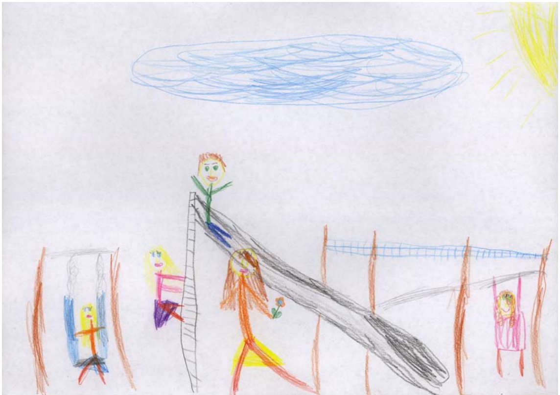
KUVA 2 Kavereiden kanssa leikkiminen on tärkeää.

Meidän tutkimuksessa lasten vastauksista ilmeni ryhmän merkitys. Lapset tiesivät hyvin, mihin ryhmään kuuluvat ja heille oma esikouluryhmä on tärkeää. Lapset mainitsivat, että ovat esikoululaisia ja sen jälkeen mennään kouluun sekä täytyy olla tietyn ikäinen, että kuuluu esikouluryhmään. Etenkin ulkoilutilanteet ovat esikoululaisten mielestä tärkeitä. Ulkona puuhaaminen on vapaampaa ja toiminta usein lapsesta lähtevää. Ulkona puuhaillessa lapsella kehittyvät monet taidot eri tavalla kuin sisätiloissa. Tytön piirtämässä kuvassa 2 on useita kavereita, kaikki leikkivät sovussa ja heillä on iloinen ilme. Aurinko paistaa. Kuvassa leikkiminen on aktiivista toimintaa, kaikki lapset saavat osallistua. Kuvasta ilmenee hyvin, kuinka tärkeää toiminta yhdessä toisten kanssa on. (KUVA 2)