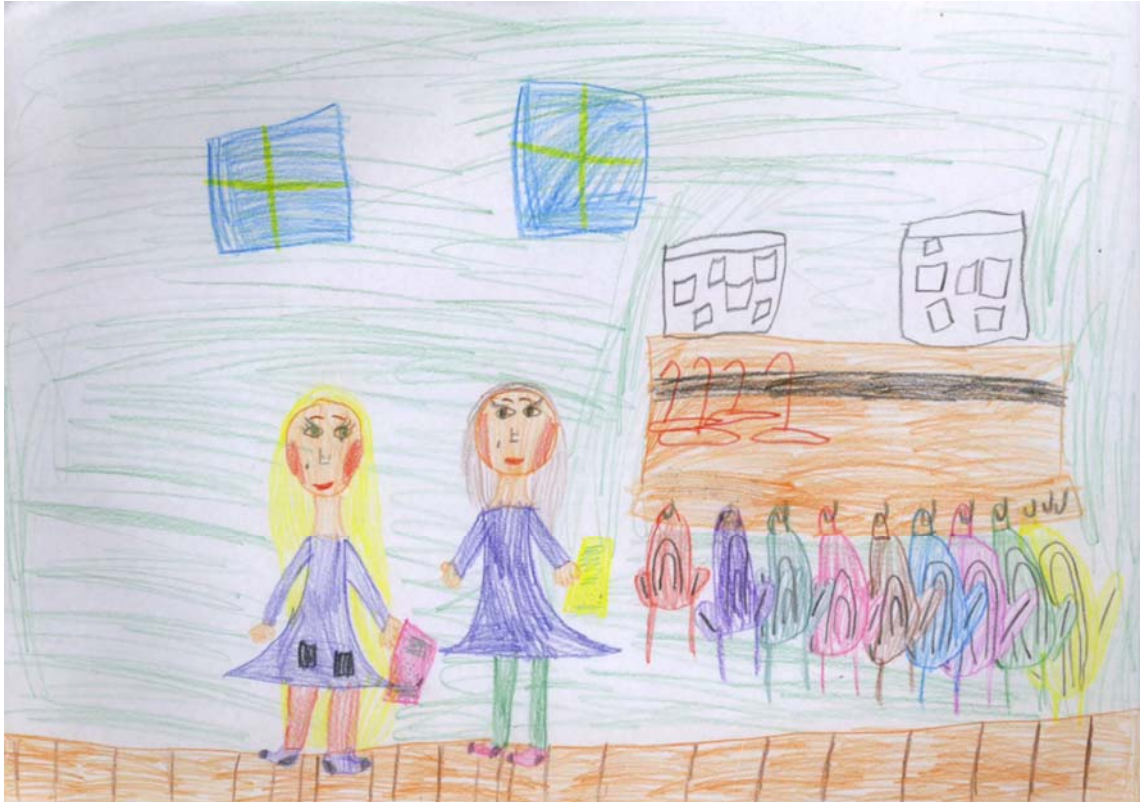
KUVA 1. Kaverin kanssa eteisessä.