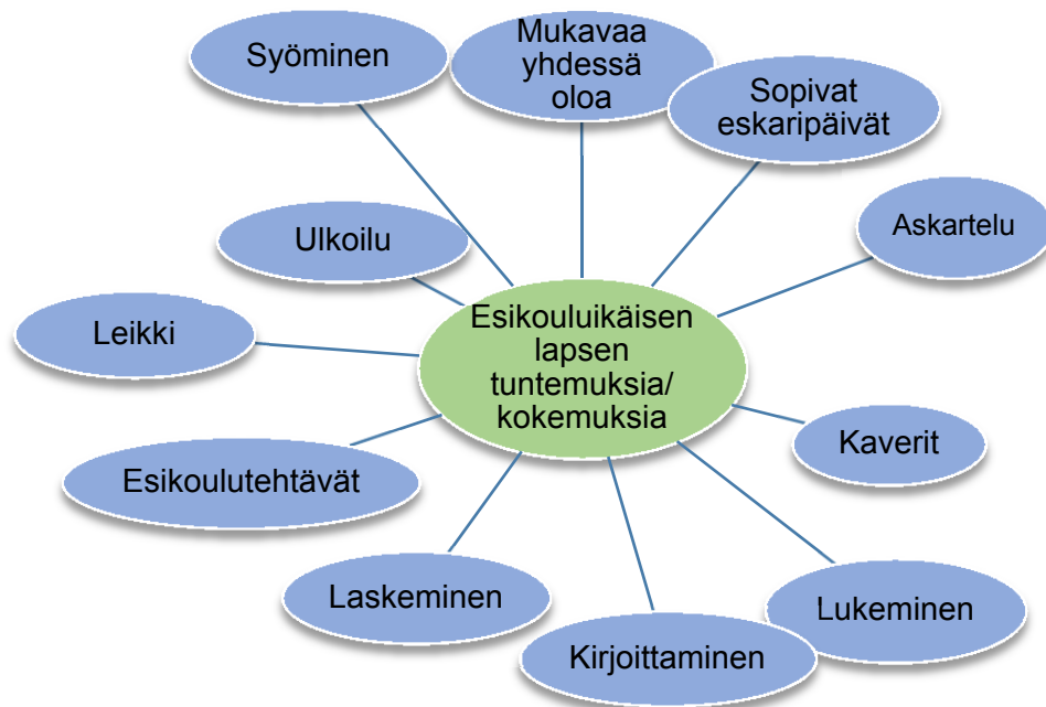
KUVIO 2. Esikouluikäisen lapsen tuntemuksia ja kokemuksia

Kuvion 2 avulla havainnoidaan esikouluikäisen tuntemuksia ja kokemuksia esikoulu-päivän ajalta. Ajallisesti muutamaan tuntiin lapsen päivästä tapahtuu monia tärkeitä, jo perustarpeiden tyydyttämiseenkin tarvittavia asioita. Esikoulutoimintaa voikin täten kuvailla monisäikeiseksi toiminnaksi myös lasten kokemusten nojalla.