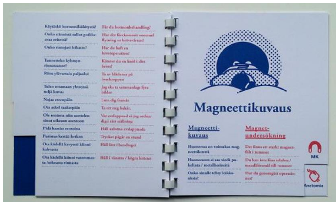
Kuvio 6. Fraasit ovat suomeksi ja ruotsiksi vierekkäin omilla väreillään. Jokaisen modalityteetin alussa on modalityteettia kuvaava kuva.