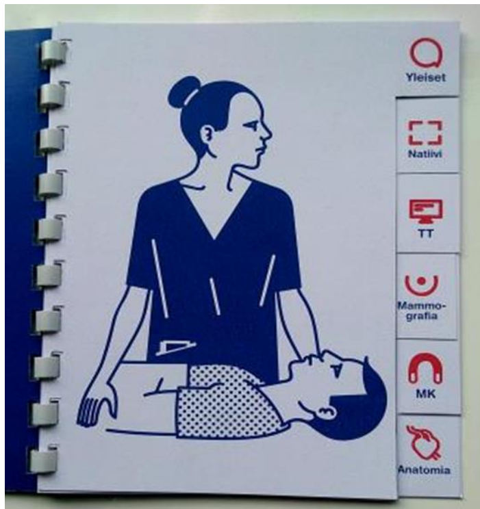
Kuvio 5. Jokaiseen modalityteettiin on luotu leikkisiä symboli.

ja värejä kuin teksteissä. Fraasit ja kuvat ovat valkoisella pohjalla. Opaskirjan sidonnassa on käytetty muovista kierrettä, joka mahdollistaa oppaan käytön magneetti-huoneessa.