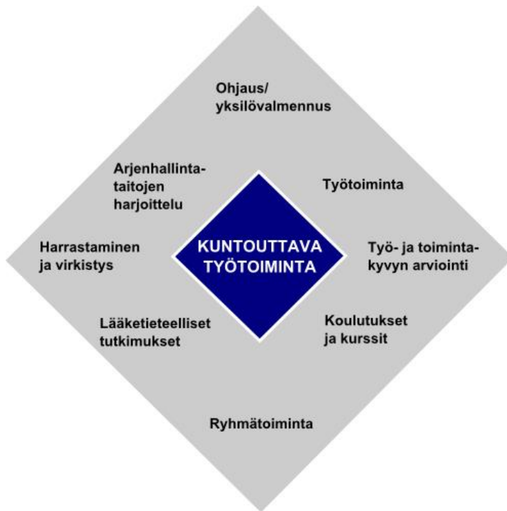
KUVIO 1 Esimerkkejä kuntouttavaan työtoimintaan sisällytettävistä palveluista (THL, hakupäivä 29.8.2013)