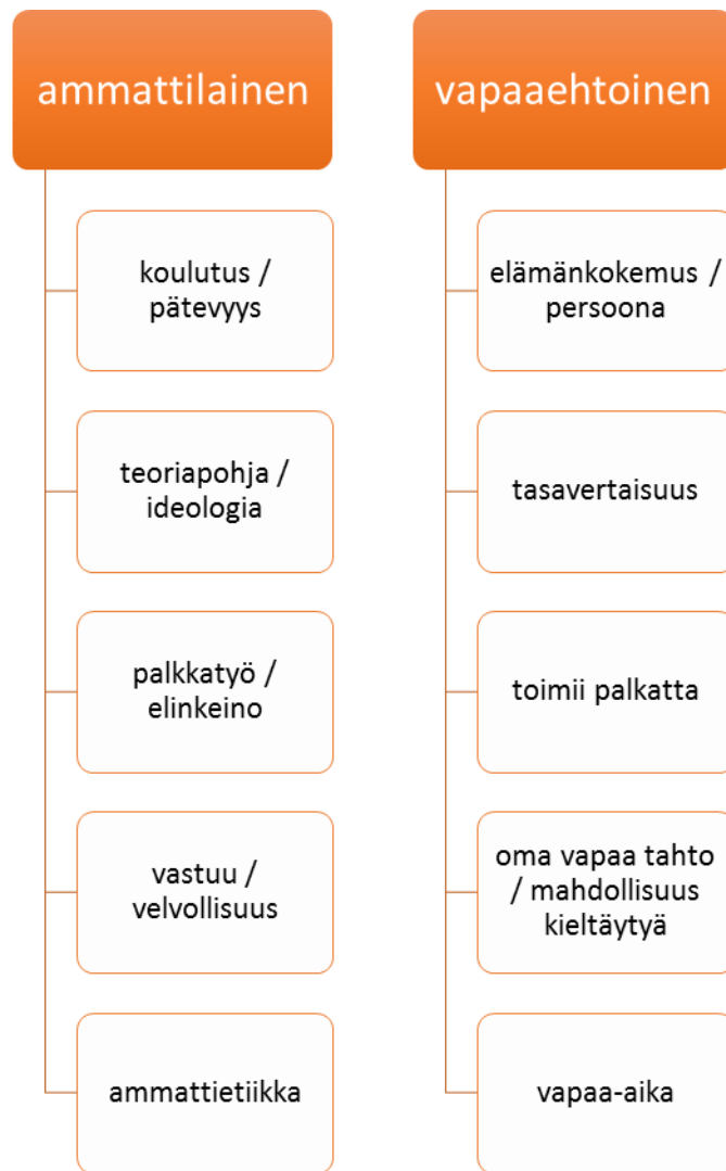
Kaavio 1. Ammatillisuuden ja vapaaehtoisuuden täydentävä vaikutus toisiinsa.