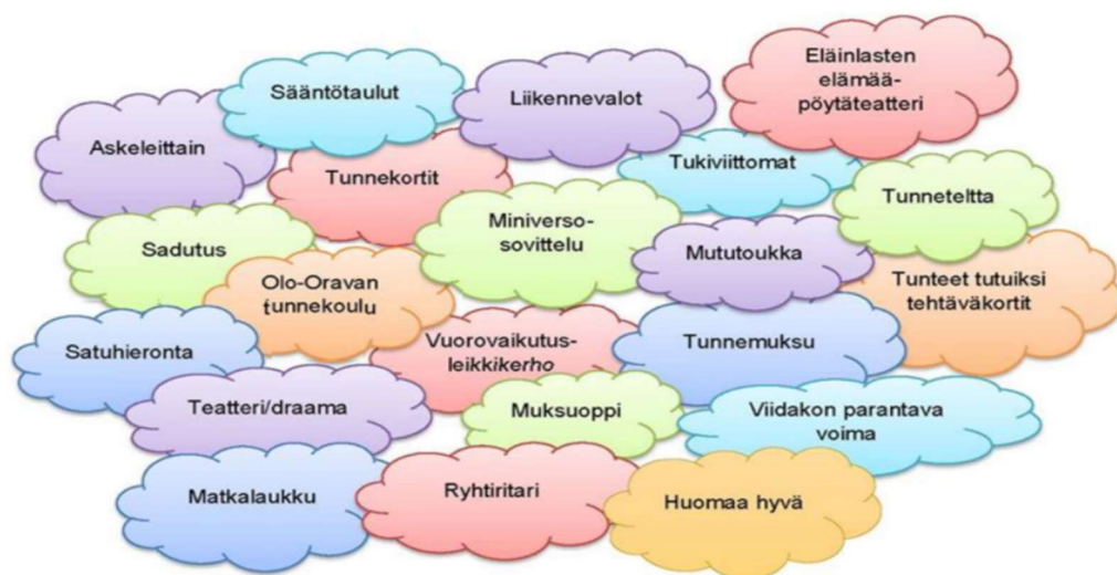
Kuvio 1. Materiaaleja kiusaamisen ehkäisyyn (Kauhavan kaupunki 2019.)

Kauhavan paikalliseen varhaiskasvatussuunnitelmaan on liitetty vuonna 2019 kiusaamisen ehkäisyn ja puuttumisen suunnitelma. Suunnitelma käsittelee kattavasti kiusaamisen ehkäisyn ja puuttumisen keinoja. Yhteisten sääntöjen laatiminen lapsille ja työtiimille varmistavat turvallisen kasvuympäristön koko ryhmälle. Suunnitelmasta nousee esiin pienryhmissä toimiminen ja sosiaalisten ja emotionaalisten taitojen harjoittelu, jolla kehitetään lapsen itsesätelyn taitoja sanoittamalla ja kuvittamalla tunteita. Lapsen itsetunnon vahvistaminen tulee näkyä kannustamisena ja lapsen vahvuuksien sanoittamisena. Suunnitelman mukaan, luottamuksellinen kasvatuskumppanuus ja yhteistyö vanhempien kanssa on tärkeää. Kiusaamisen ehkäisyn tueksi hyödynnetään erilaisia materiaaleja, joita on esitelty kiusaamisen ehkäisyn ja puuttumisen suunnitelmassa. Materiaaleja voi tarkastella tarkemmin kuviosta 1. (Kauhavan kaupunki 2019.)