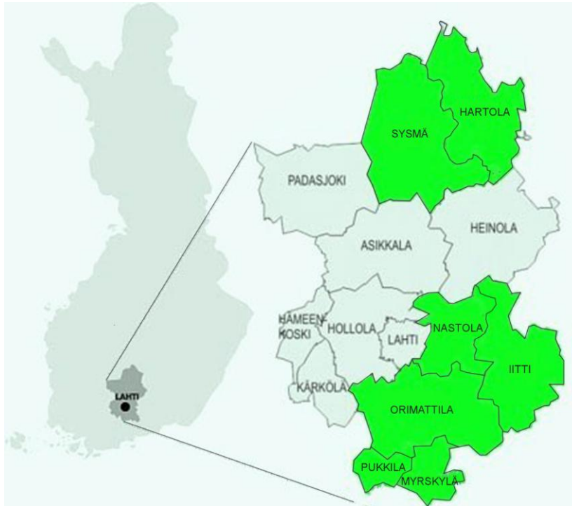
Kuvio 1. Päijät-Hämeen sosiaali- ja terveydenhuollon kuntayhtymän kunnat (mukaiillen Päijät-Hämeen Koulutus konserni n.d.)

lut sekä ympäristöterveydenhuollon ja eläinlääkintähuollon palvelut siltä osin kuin kunnat ovat antaneet toiminnot yhtymän hoidettavaksi. (Päijät-Hämeen sosiaali- ja terveysyhtymä n.d.) Alla olevassa kuviossa on esitetty Päijät-Hämeen sosiaali- ja terveydenhuollon kuntayhtymään kuuluva alue. Peruspalvelukeskus Aava – liikelaitokseen kuuluvat kunnat on merkitty vihreällä värillä.