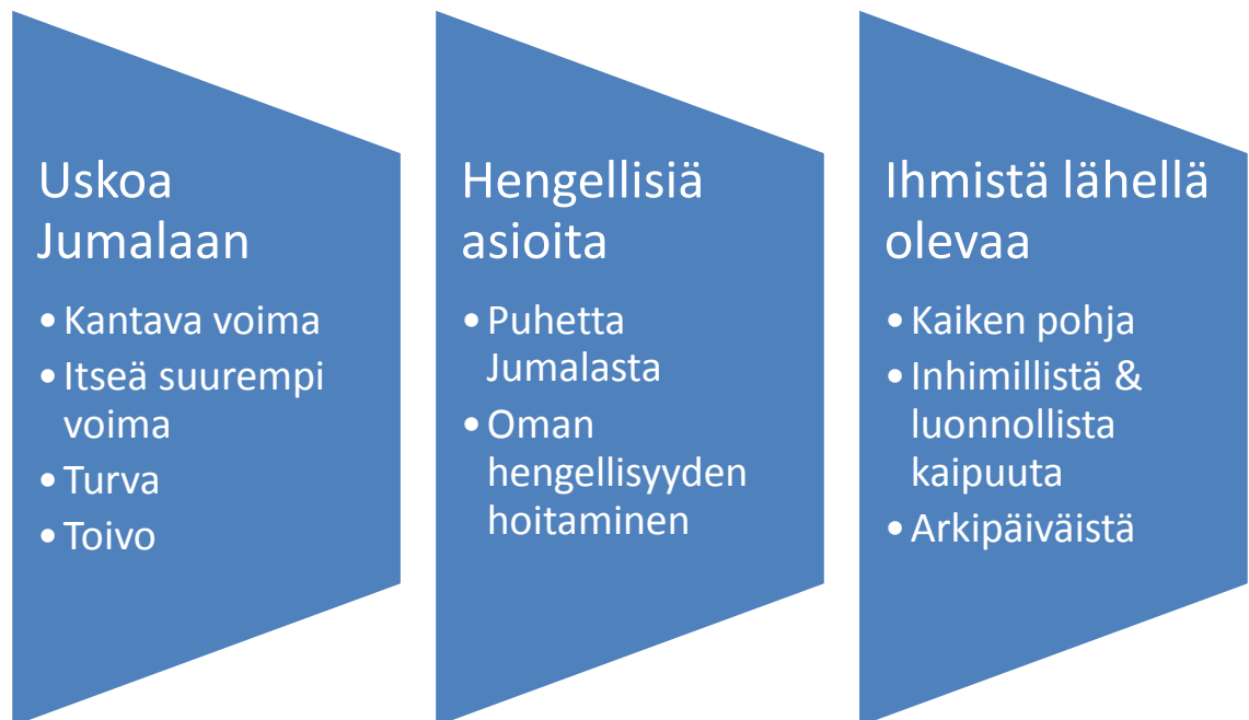
KUVIO 1. Mitä on hengellisyys

Arkisella tarkoitettiin sitä, että hengellisyyden ei tarvitse näyttää hienolta eikä sen tarvitse olla tietynlaisia sanoja tai tekoja. Arkisella tarkoitettiin, että ihminen saa olla oma itsensä ja hänet hyväksytään juuri niin vajavaisena kuin hän on. Hengellisyyden inhimillisyys ja arkisuus perusteltiin kristinuskon ihmiskäsityksen ja Jumalan armon kautta. Kristinuskon on armollinen: ihmisen ei tarvitse olla jotakin hienoa, vaan hän riittää juuri sellaisena kuin hän on. Haastateltava kokivat hengellisyyden olevan juuri näin inhimillistä ja ihmistä lähellä olevaa. Lisäksi esiin nousi ajatus, että hengellisyys ei ole mikään erillinen asia meistä, vaan se on hyvin inhimillistä ja hyvin ihmisläheistä.