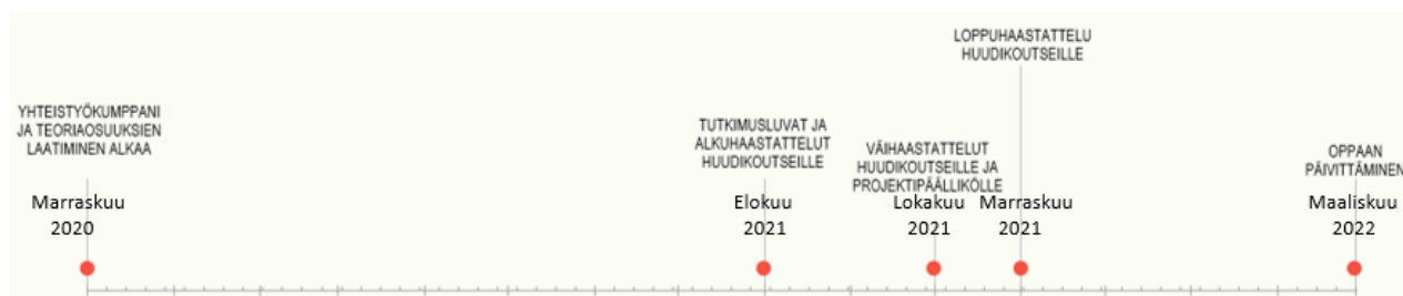
KUVIO 3: Kuvio avaa opinnäytetyön oppaan toteuttamisprosessin.

Tapasimme loppuvuonna 2020 opinnäytetyön yhteistyötahon, jolloin opinnäytetyöprosessi alkoi. Aloitimme työskentelyn tekemällä alkuhaastattelun huudikoutsille, jonka perusteella lähdimme luomaan opasta. Oppaan sisältöä varten keräsimme eri kautta tietoja Helsingin julkisen ja kolmannen sektorin päihdepalveluista. Haastatteluissa tuli ilmi erilaisia toimijoita, joita myös sisällytimme oppaaseen. Haastattelut olivat tärkeä osa oppaan työstöä, sillä halusimme sisällön vastaavan juuri sitä tarvetta, mitä huudikoutsit ovat havainneet jalkautuessaan.