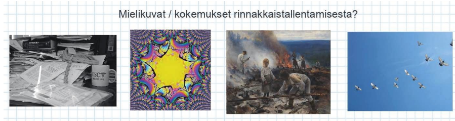
Kuvio 1. Mielikuvia rinnakkaistallentamisesta.

kokemustaan tai mielikuvaansa kuvastamaan. Työpajan osallistujien valinnat vaikuttavat ainakin pintapuolisesti kertovan työhön liittyvästä hajanaisuudesta ja sekalaisuudesta, värikkäistä käytännöistä, monimutkaisuudesta, raskaudestakin.