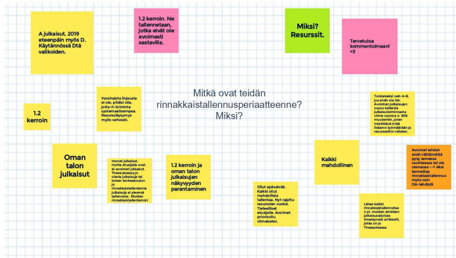
Kuvio 2. Rinnakaistallennusperiaatteen toistui 1.2 kerroin.

Toisissa ammattikorkeakouluissa on linjaus, että henkilöstön artikkelit rinnakaistallennetaan kun se on mahdollista, ja rinnakaistallentaminen on selvä osa julkaisutietojen käsittelyä.